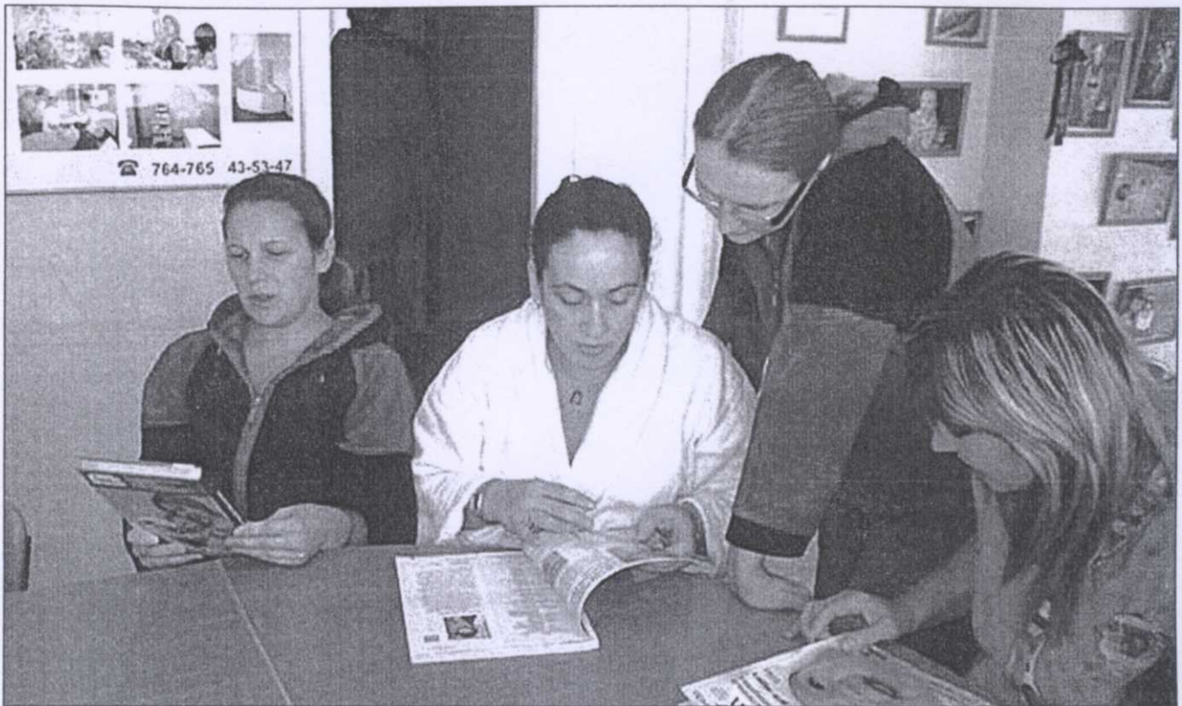
Пришли свежие журналы, книжные новинки

«Семья. Книга. Библиотека» (детская библиотека г. Малоархангельска), «Растём вместе с книгой» (Центральная детская библиотека имени И.А. Крылова ЦБС г. Орла), «Любимые книги нашей семьи» (филиал № 13 имени М. Горького ЦБС г. Орла).