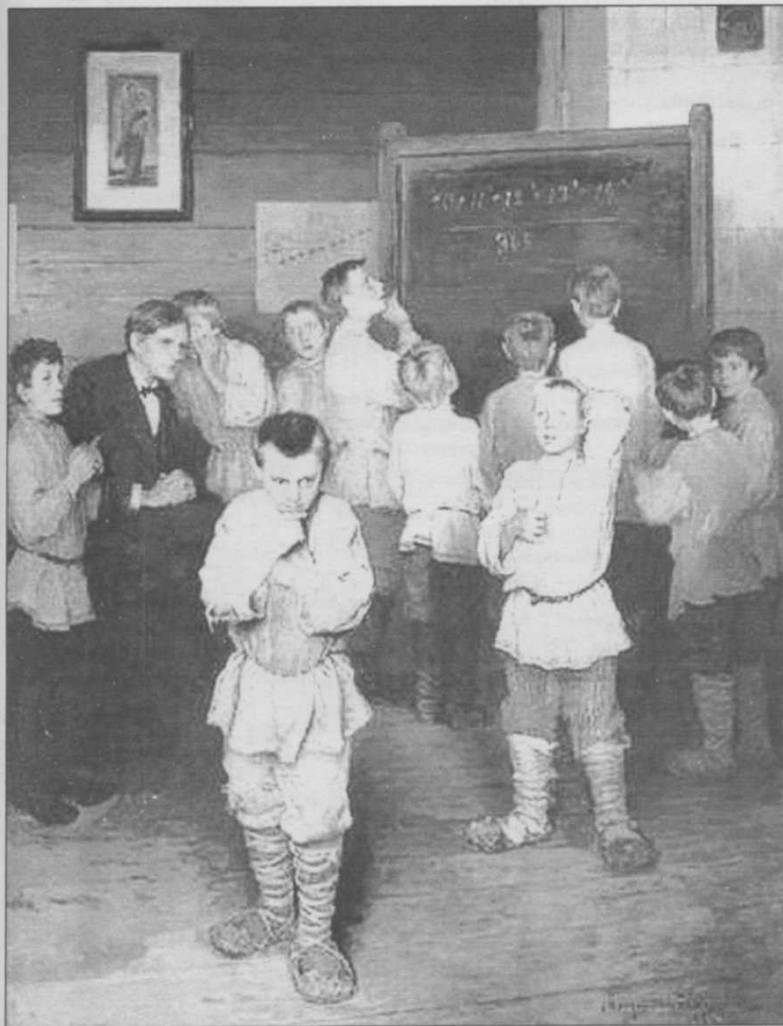
Устный счёт. В народной школе С.А. Рачинского. Художник Н.П. Богданов-Бельский