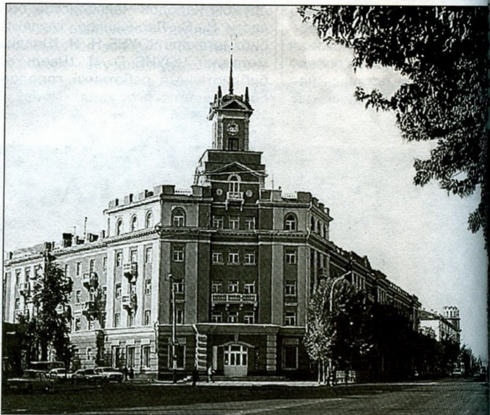
Здание, в котором размещается библиотека

Здесь сохранилось дворянское гнездо с домом, который легенда связывает с тургеневской Лизой Калитиной; Пушкинские и Посадские улицы помнят детство и юность Леонида Андреева, по