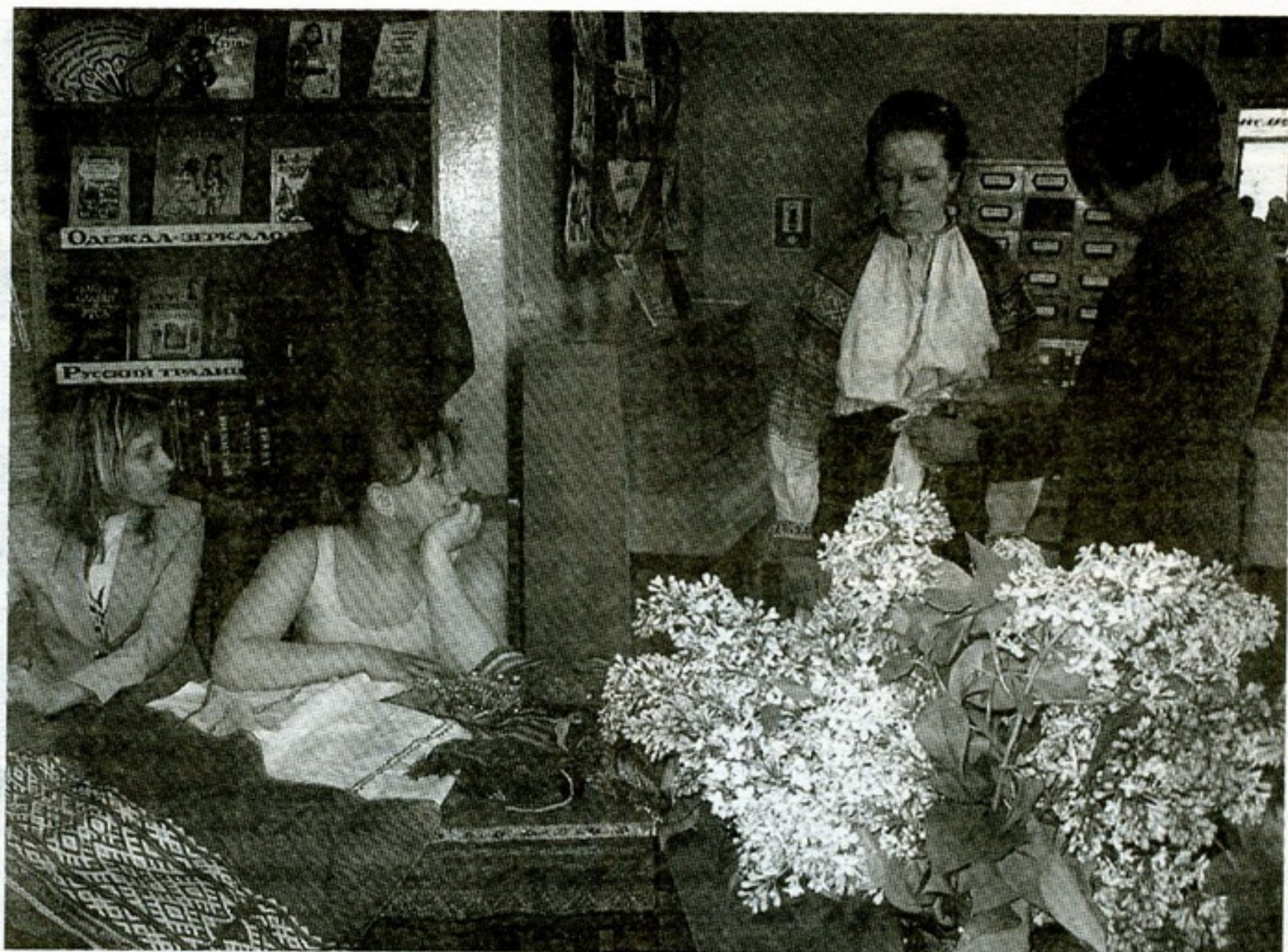
Знакомство с народным костюмом

мету? Подавляющая часть посетителей учреждения обращается за краеведческой литературой к нам. Половина читает такие книги потому что интересуются данной тематикой, меньшее число читателей «доводит» до этого необходимость. К тому же мы спрашиваем у детей, какие именно работы истории родного края попадают им в руки. Список, полученный с помощью респондентов, порадовал. В него вошли как работы известных краеведов, ставшие уже хрестоматийными, так и новые издания. Это свидетельствует о том, что читатели внимательно следят за новинками в этой сфере, стремятся узнать новые факты.