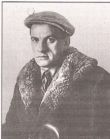
Владимир Владимирович Маяковский. 1920 г.

БИБЛИОТЕКАРЬ (2): Там он провёл 11 месяцев и там же сочинил свои первые стихи, исписав целую тетрадку. «Спасибо надзирателям — при выходе отобрали.