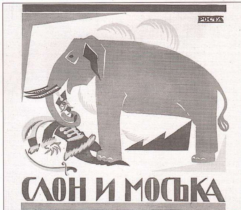
Слон и Моська. Художник В. Маяковский. 1920 г.

Ответ. «Начинается Земля, как известно, от Кремля».