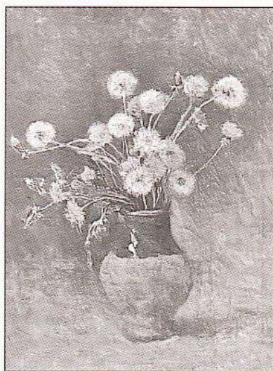
Одуванчики. Художник И. Левитан. 1880-е гг.

3 Название этого растения переводится как «цветок Зевса» или «божественный цветок». По легенде, когда в конце XIII в. во Франции свирепствовала эпидемия чумы, король Людовик IX Святой приказал лекарям изготавливать из этого цветка целебный отвар и давать его больным. Удивительно, но многих такое лекарство спасало. Во Франции цветок алого оттенка символизирует борьбу за свободу и свои взгляды. В Ита-