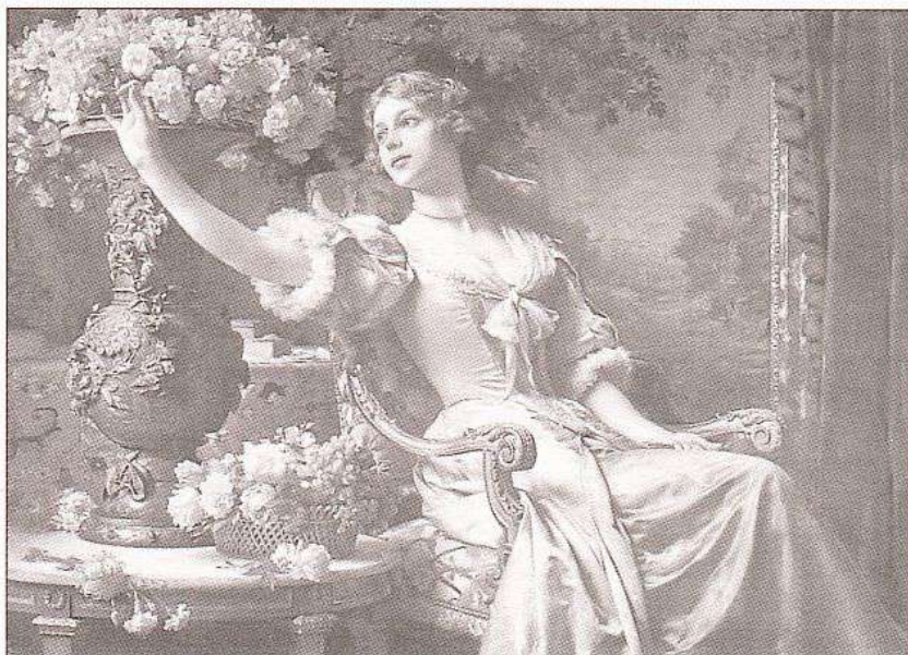
Дама в лиловом платье с цветами. Художник В. Чахурский. 1880-е гг.