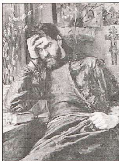
Инок. Художник К. Савицкий. 1897 г.

Похожее название носил древний город в Южной Месопотамии. Это был важный политический, экономический и культурный центр Древнего мира, первый «мегаполис» в истории человечества. Руины города — группа холмов у города Эль-Хилла (Ирак), в 90 километрах к югу от Багдада. Объект всемирного наследия ЮНЕСКО. Упоминается в Библии.