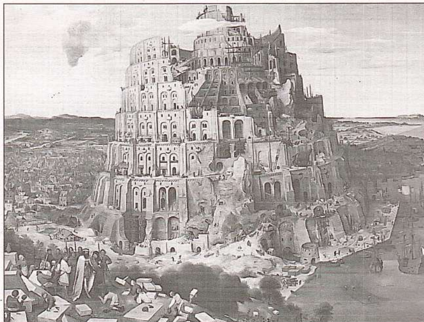
Вавилонская башня. Художник П. Брейгель старший. 1563 г.

(Помощник (3) передаёт элемент пазла и подсказку. Команда переходит на четвёртую станцию.)