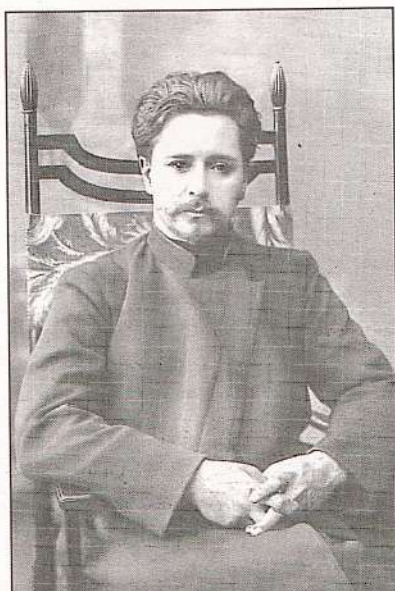
Леонид Николаевич Андреев. 1908 г.

БИБЛИОТЕКАРЬ: Наступила весна 1918 г. Запертый в своей вилле в Ваммельсуу революцией и войной, оказавшись неожиданно для себя в эмиграции. (Финляндия в силу исторических обстоятельств стала самостоятельным государством), Леонид Николаевич записал в своём в дневнике: «Страстная неделя, пятница. Как нехвата тут норд! Другое встаёт: Орёл, тепло, пахучая ракета, разлив рек, весёлая гимназическая религия, шатанье по Болховской... Или: пальто внапашку, в шитой рубашке, иду по Очному мосту и смотрю