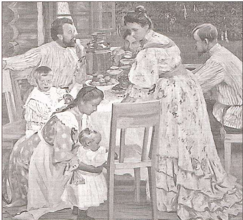
На террасе. Художник Б. Кустодиев. 1906 г.

ПОМОЩНИК (6): Ребята, когда Л.Н. Андреев начал публиковаться в «Московском вестнике», он подписывался фамилией матери — Пацковский. Интересен