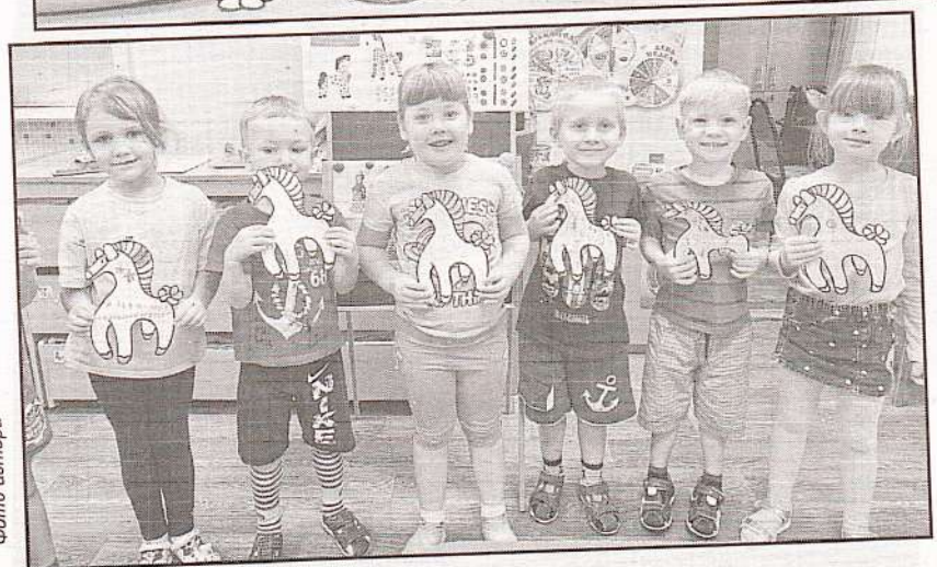
Ребята раскрасили шаблон лошадки, и вот какие замечательные дымковские игрушки у них получились!

МАСТЕРИЦА: До новых встреч на занятиях! Буду рада вас видеть!