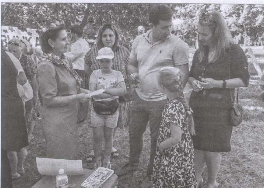
▲ Одно из мероприятий арт-полянки ООДБ – квиз «Тургенев знакомый и незнакомый». Автор статьи даёт игрокам очередное задание

Вечер пролетел как одно мгновение. Было очень приятно чувствовать доброжелательное внимание орловцев к «Пришвинке». Вокруг нас на площадке «Среди цветов и книг» собрались друзья. Одни давно и регулярно посещают ООДБ. Другие совсем скоро впервые придут на ул. Московскую, 28, но наверняка останутся с библиотекой на долгие годы. Ну а мы готовы «идти в народ» с новыми познавательными интерактивными программами!