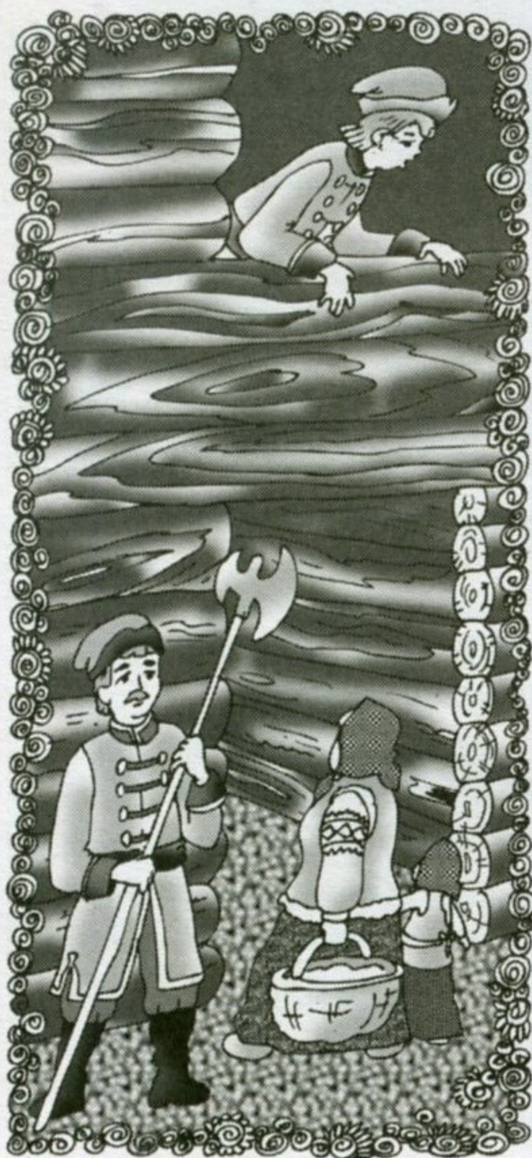
Рис. С. Черняева