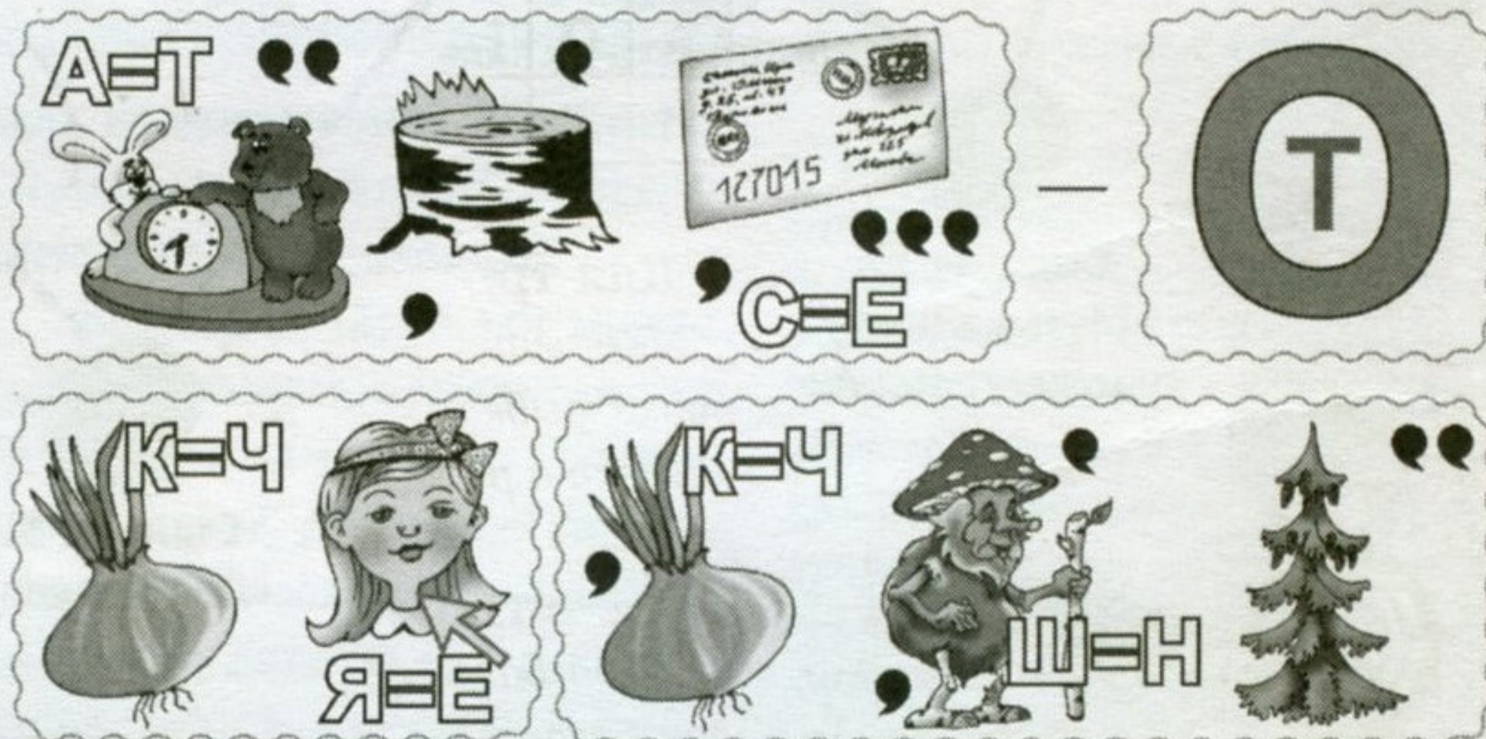
Рис. С. Черняева