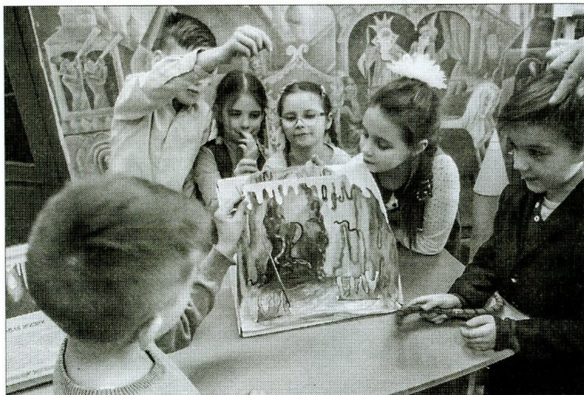
▲ Первые спектакли в ОДБ состоялись в год 200-летия И.С. Тургенева. Дебютной стала постановка сказки писателя «Капля жизни»

всё-таки есть. В 2018 г. в Неделю детской и юношеской книги наши читатели попробовали себя в качестве актёров и представили зрителям наполненную глубоким смыслом сказку «Капля жизни», а затем смешную, но поучительную историю «Самознайка» в жанре экспромт-театра. Несмотря на громкое имя автора-классика, инсценировки получились совсем не сухими и не строгими. Ребята импровизировали, добавляли свои реплики, вносили элементы современности. А это значит, что творчество знаменитого юбиляра открылось для юных читателей с новой стороны.