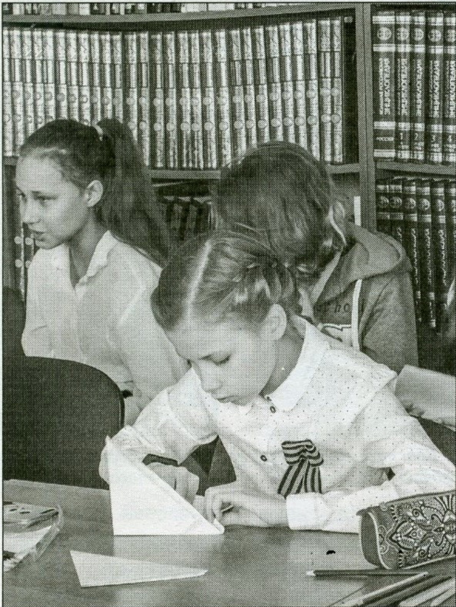
■ Научившись складывать солдатский треугольник, невольно проникаешься чувствами и мыслями тех, кто это делал в сороковые, пороховые