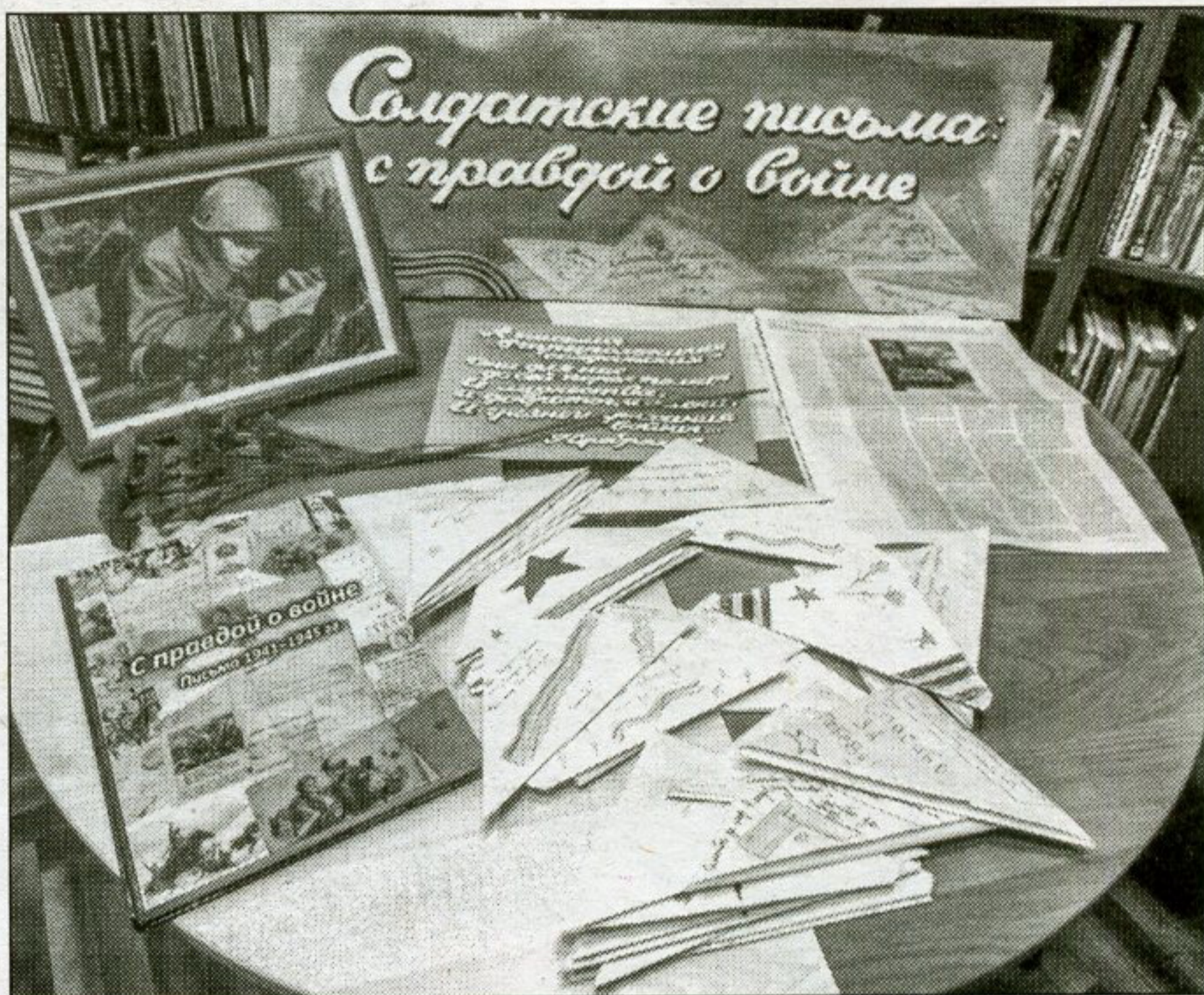
■ Вот такие письма со словами благодарности ребята подготовили в ходе мастер-класса