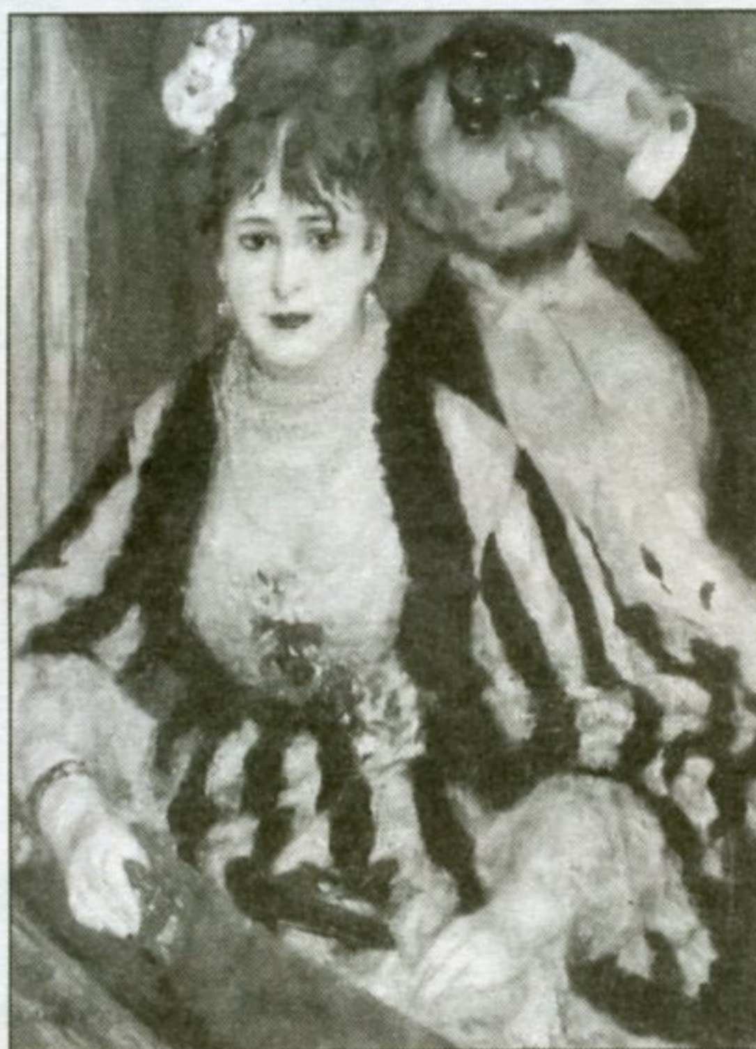
В ложе. Художник П.О. Ренуар. 1874 г.

4. Персонаж какой сказки купил билет на кукольный спектакль за четыре сольдо, отдав за них новую азбуку с картинками? (Буратино, герой А.Н. Толстого.)