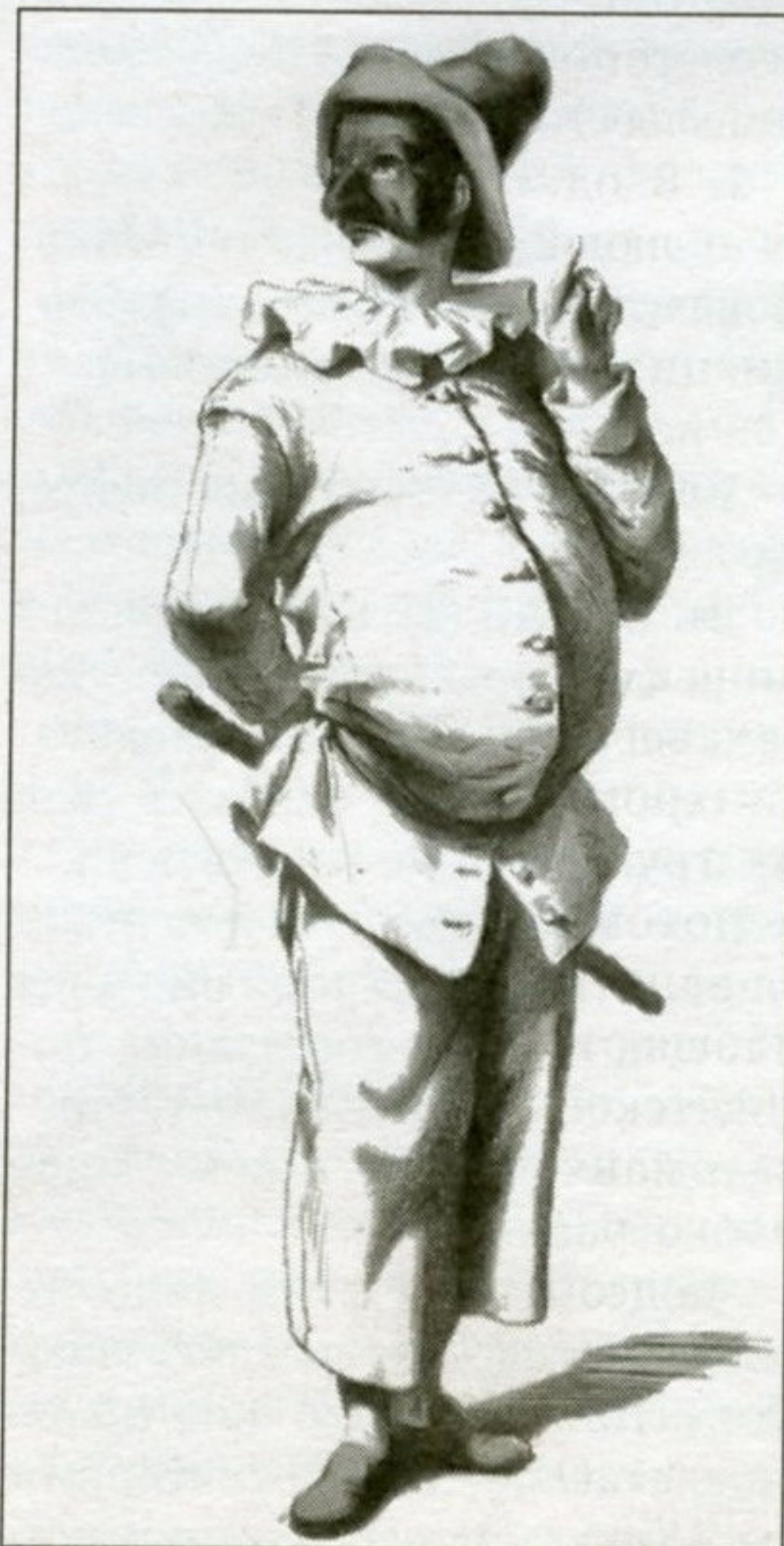
Костюм Пульчинеллы. Рисунок М. Санда. 1860 г.

стоили дешевле в XIX в.? И зачем заядлые театралы приходили на спектакли на пару часов раньше? (В пушкинские времена не весь зал был занят креслами, а лишь пара первых рядов. Эти места предназначались для знатных и состоятельных господ. За ними располагались стоячие