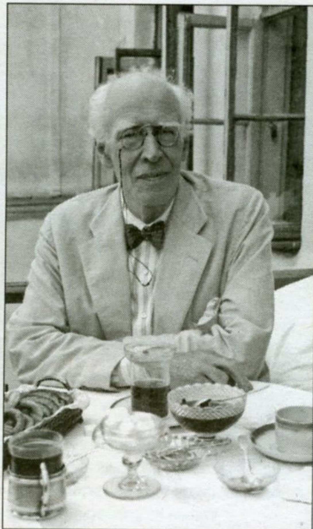
Константин Станиславский. 1920-е гг.

2. В наше время мы стараемся купить билеты на спектакль заранее. Так можно приобрести их по выгодной цене и выбрать наиболее удобные места в зале. А на какие места, в какую зону зрительного зала билеты