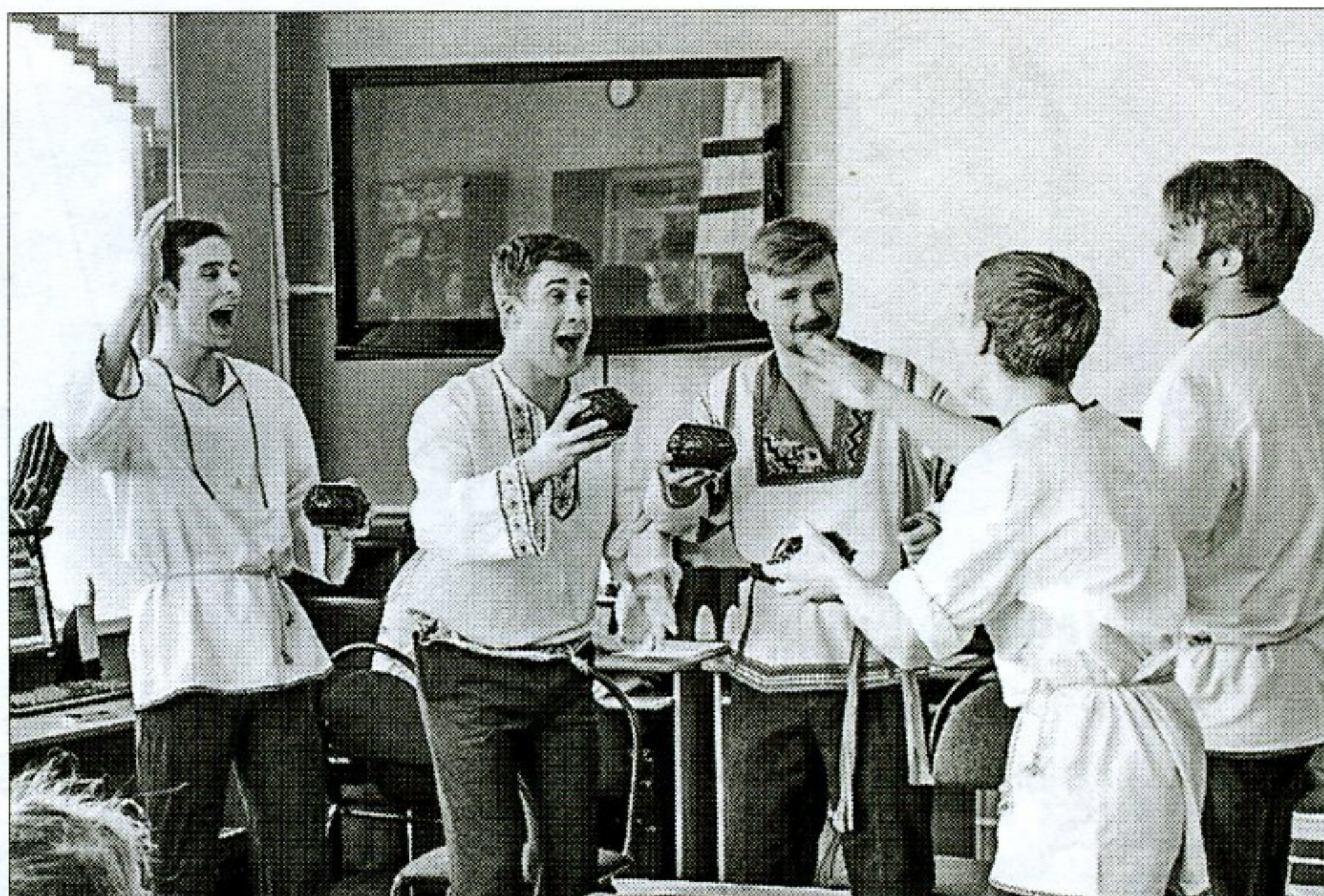
▲ Артисты студенческого эстрадного театра «Весёлая маска» инсценируют произведение «Певцы»

Завершилась Неделя детской и юношеской книги традиционным областным читательским праздником, который ежегодно проходит в одном из муниципальных образований Орлов-