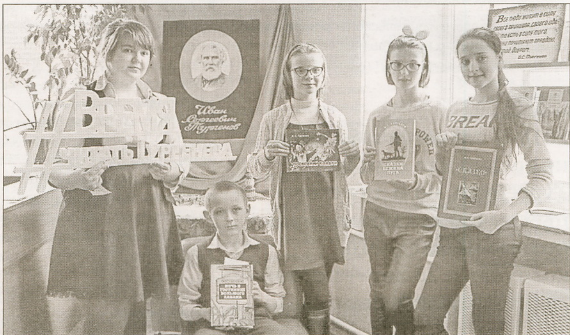
■ В Орле сегодня время читать И.С. Тургенева