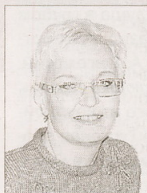
Орловская областная детская библиотека имени М.М. Пришвина