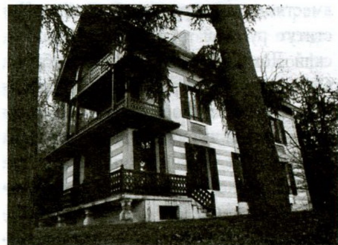
Европейский музей — Дача И. С. Тургенева в Буживале, Франция

музее И. С. Тургенева, не послужит указующим перстом для властей, не побудит их помочь достойному празднованию дня рождения великого русского классика, то праздник целиком ляжет на плечи музейных и библиотечных работников, которым И. С. Тургенев близок и дорог.