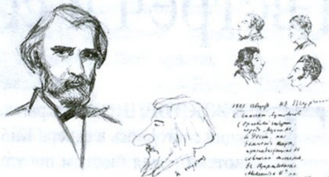
Игра в портреты (рисунки И. С. Тургенева)

Двухсотый день рождения настал, Мы отмечаем памятную дату ныне, Того, кто умирая на чужбине, Стихотворенья в прозе написал.