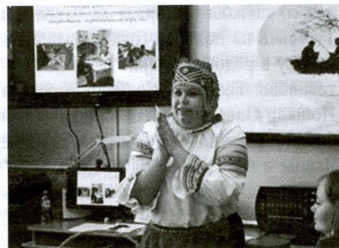
На мастер-классе «Птица-радость»

знакомство с с музеем-заповедником «Спасское-Лутовиново», Музеем И. С. Тургенева в Орле, участие в тургеневском литературном празднике на «Дво-