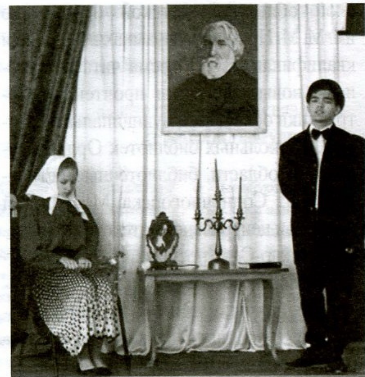
Рассказ Тургенева «Свидание»

Дети в возрасте от 12 до 15 лет не просто читали произведения И. С. Тургенева: они смогли под руководством библиотекаря примерить тургеневские