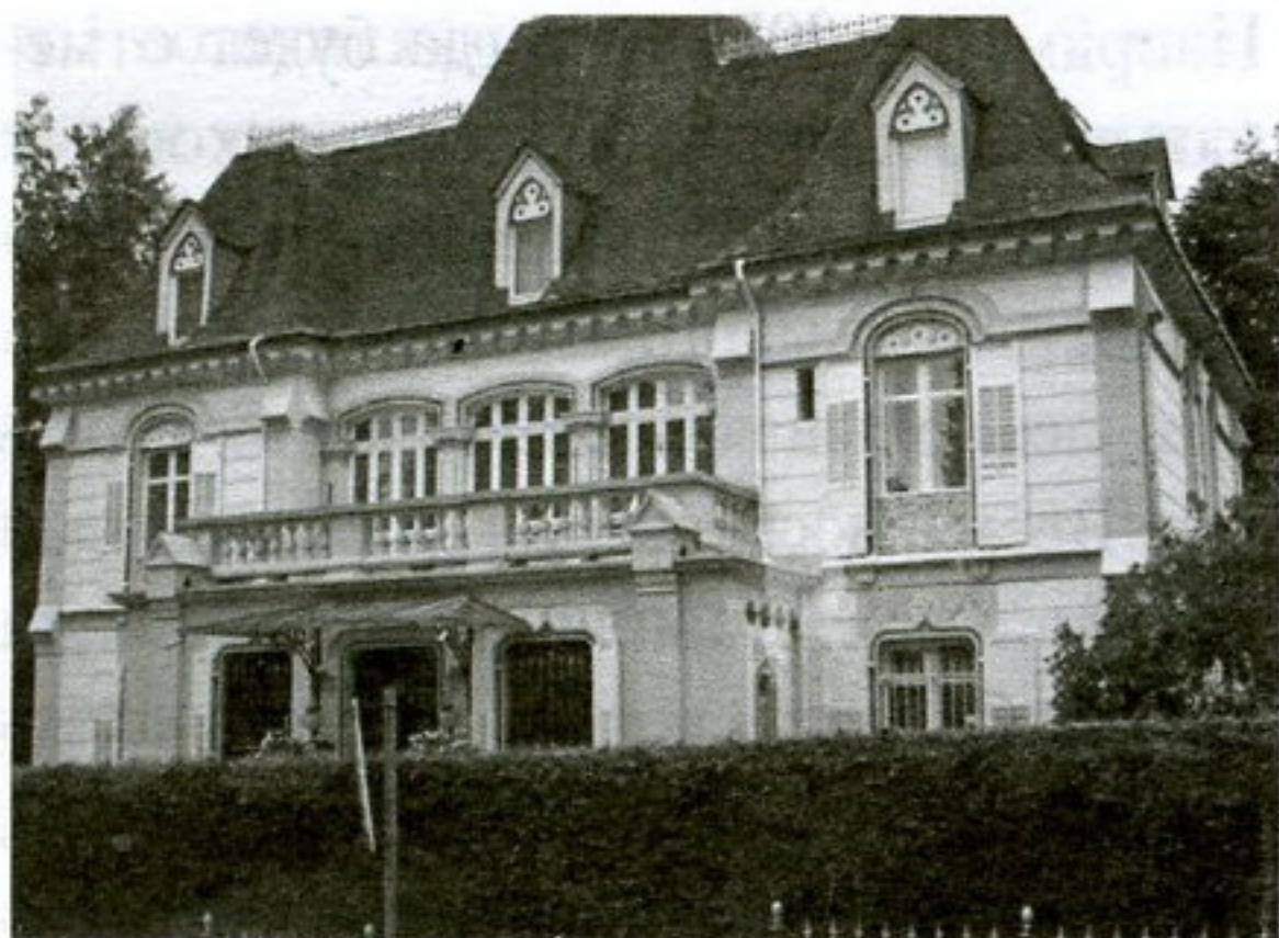
Вилла И. С. Тургенева в Баден-Бадене, Германия

тором» празднования тургеневского юбилея в столице. Не все предложения Тургеневки и Тургеневского общества были приняты Департаментом культуры. Так, московскими властями не была поддержана идея проведения праздничного литературно-музыкального концерта в большом концертном или театральном зале в центре Москвы, как это бывало в советское время. Например, в Колонном зале Дома Союзов, бывшем Благородном (Дворянском) собрании, где Тургенев 7 июня 1880 г. выступал со своей знаменитой речью в дни открытия памятника Пушкину на Тверском бульваре. Конечно, времена, когда подобные концерты устраивались в Большом театре, давно миновали. Но неужели русские литераторы, чьи юбилеи отмечались в последние полтора десятилетия (Гоголь, Гончаров, Лермонтов и другие), не заслуживают торжественного вечера в столичном концертном зале? Можно только сожалеть, что эта традиция ушла из нашей общественной жизни.