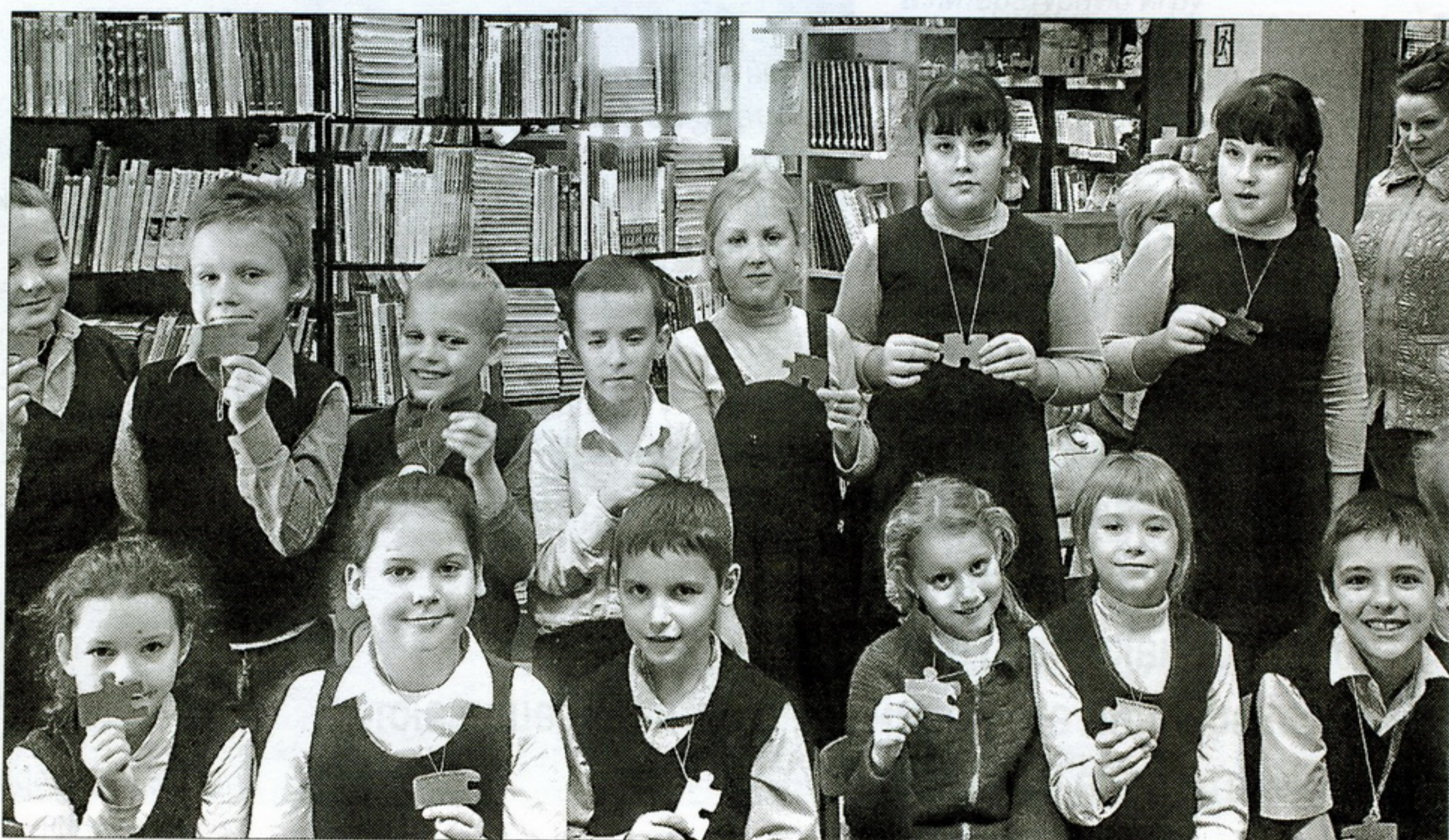
По завершении занятий юные читатели точно научатся странствовать по интернету с пользой для себя ▶

Молодцы, ребята! Пришло время подвести итоги нашего путешествия.