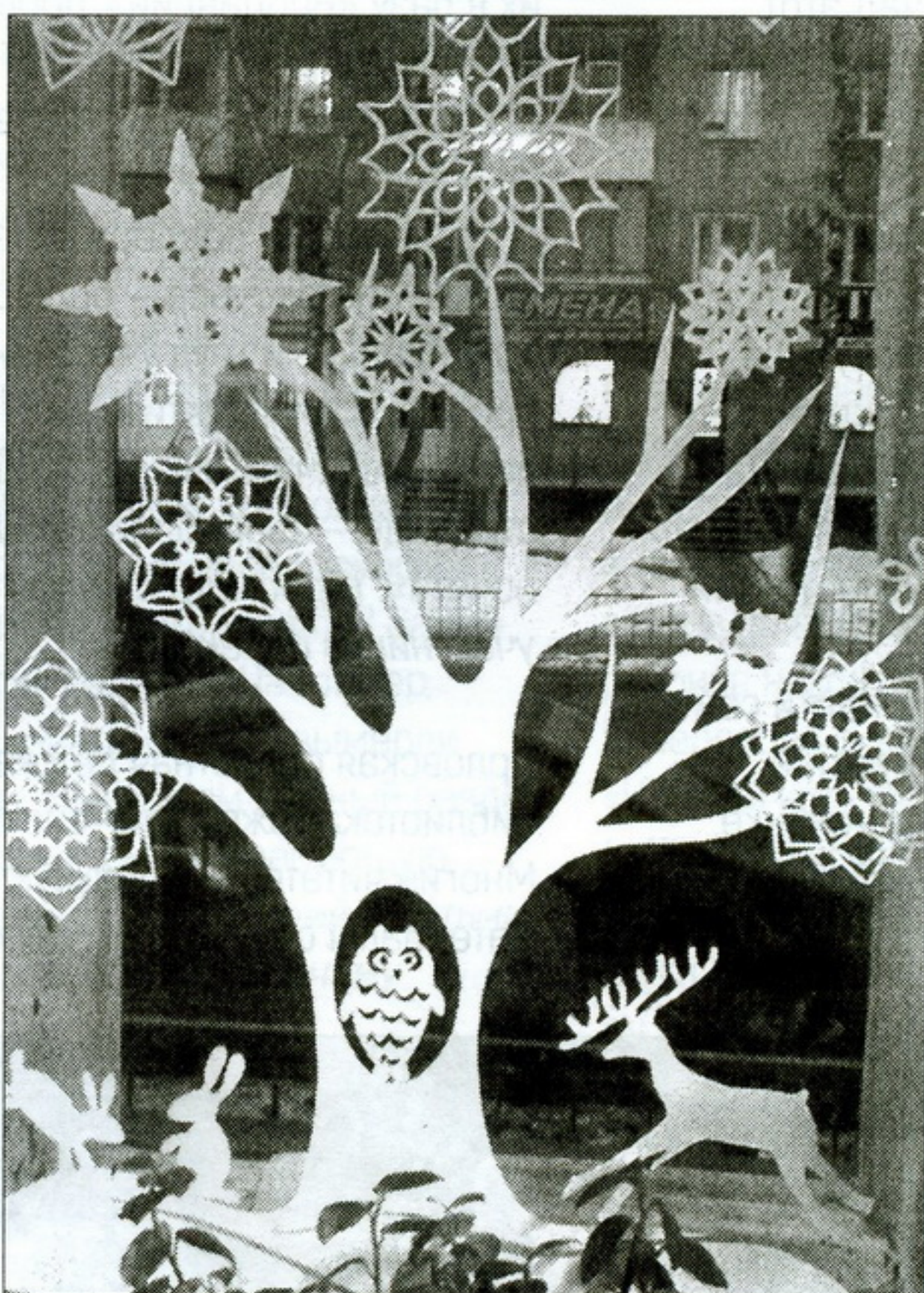
▲ Несколько щелчков мышью — и чудной красоты снежинка готова...