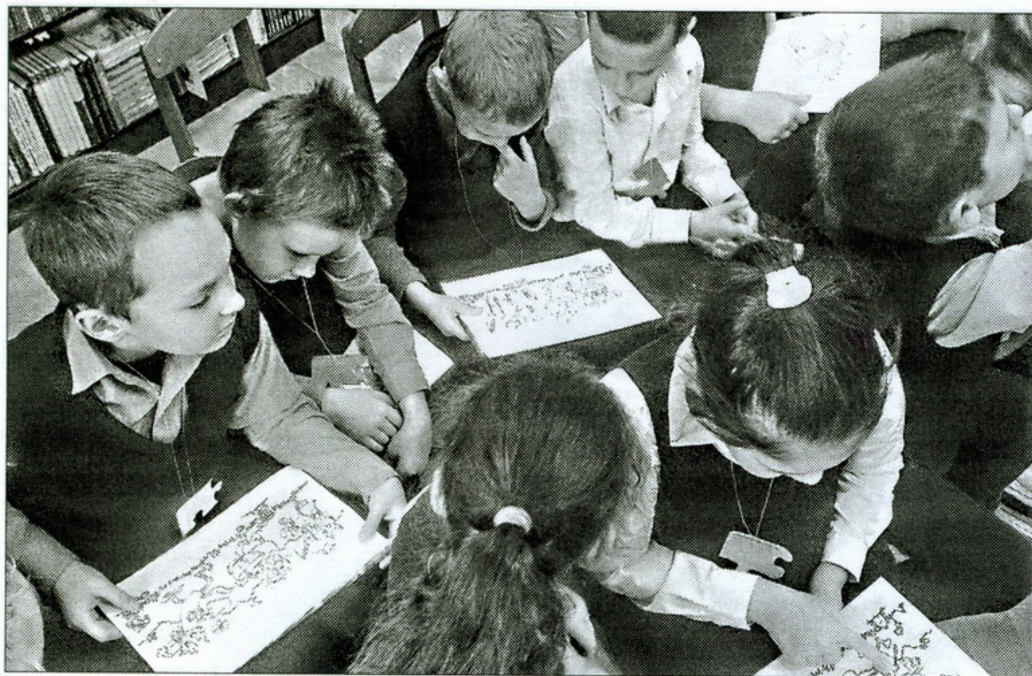
▲ «А сейчас мы проверим, насколько развита ваша фантазия: раскрасьте картинки и придумайте свою историю по мотивам получившихся рисунков»

и раскраски». Вы помните, что надо указать, прежде чем начать выбирать сайт? (Ответы детей.)