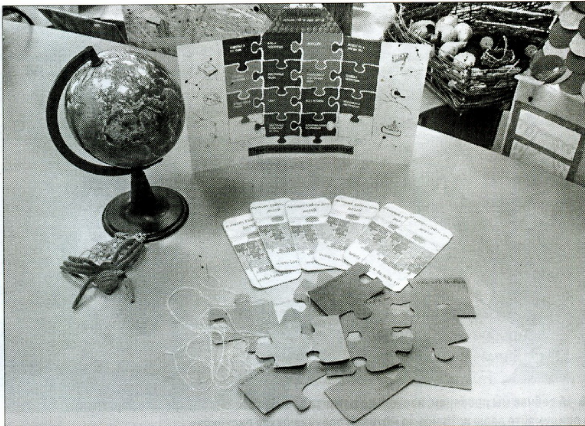
▲ Вот из таких небольших частей и сложился огромный ресурс

В рубрике «Электронные и справочные ресурсы» открываем вкладку «Энциклопедии, словари, справочники». Теперь надо указать возраст. Фильтр отберёт ресурсы специально для вас и ваших ровесников.