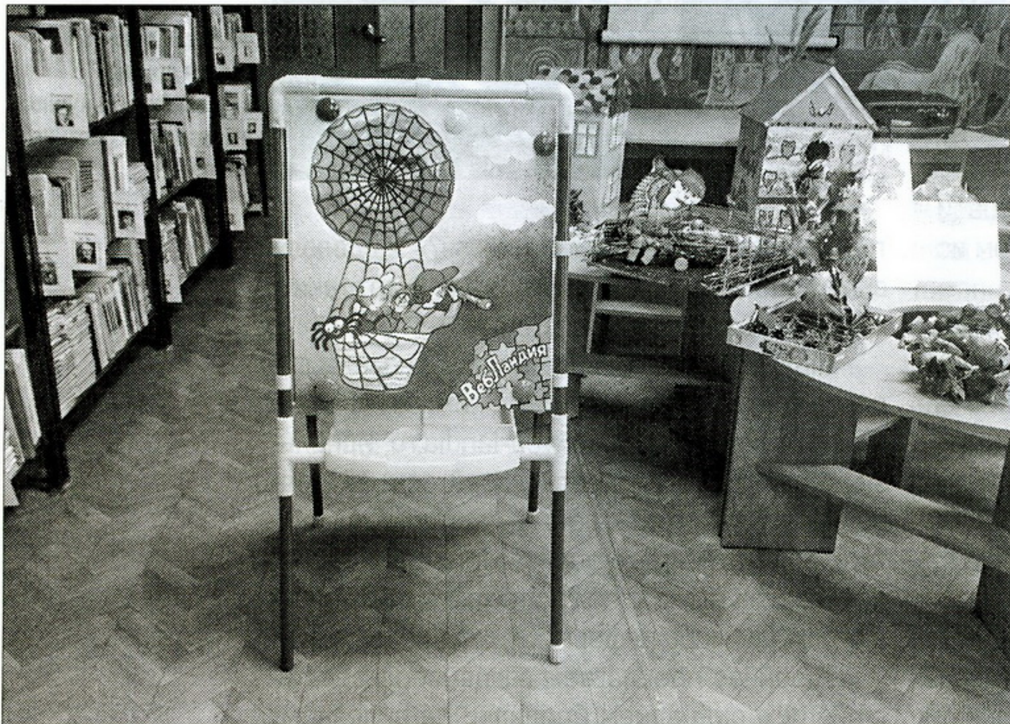
▲ Как оказалось, «ВебЛандия» предлагает множество идей для проведения досуга