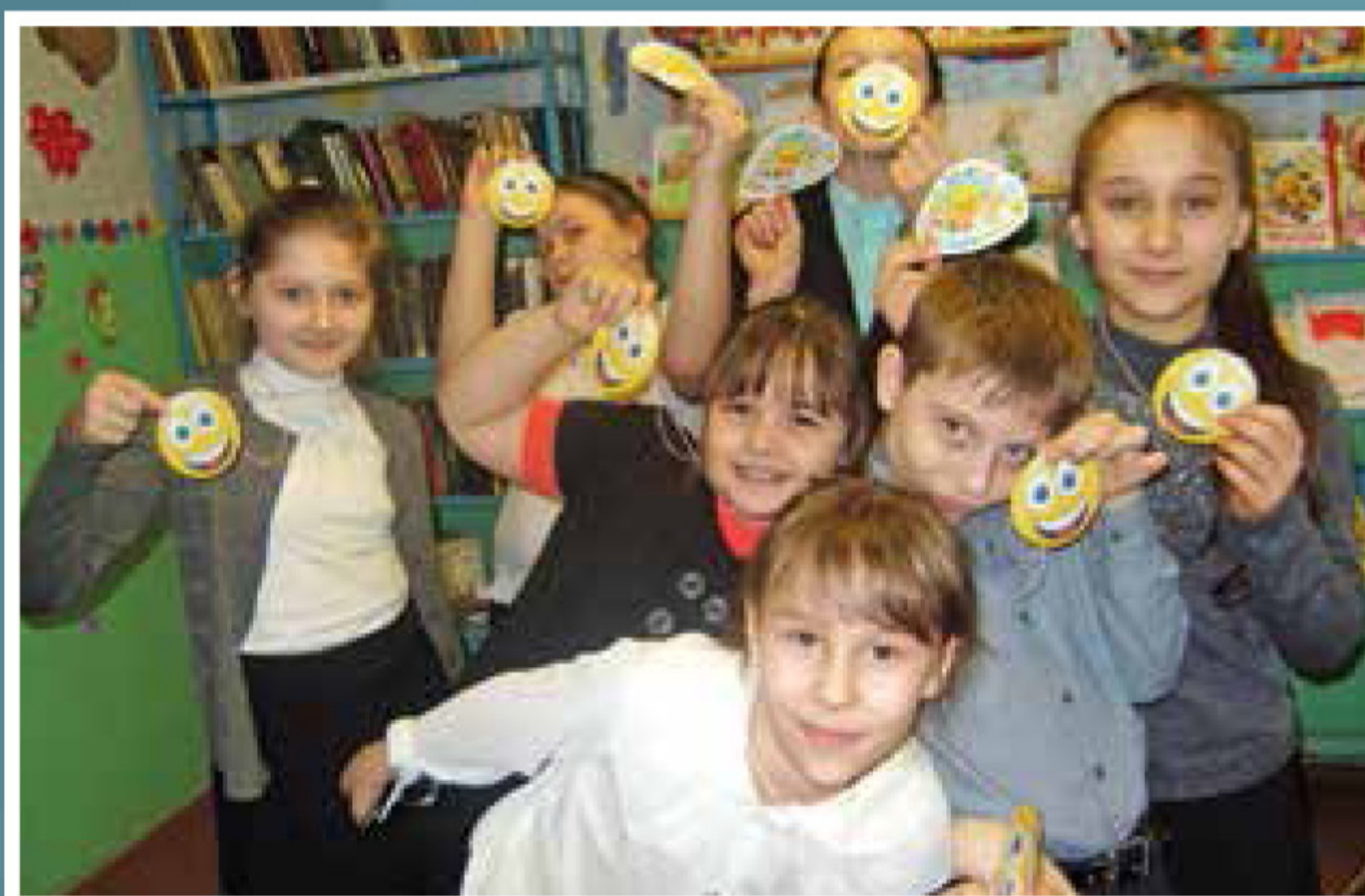
■ Областная неделя детской книги – любимый праздник юных новосильцев