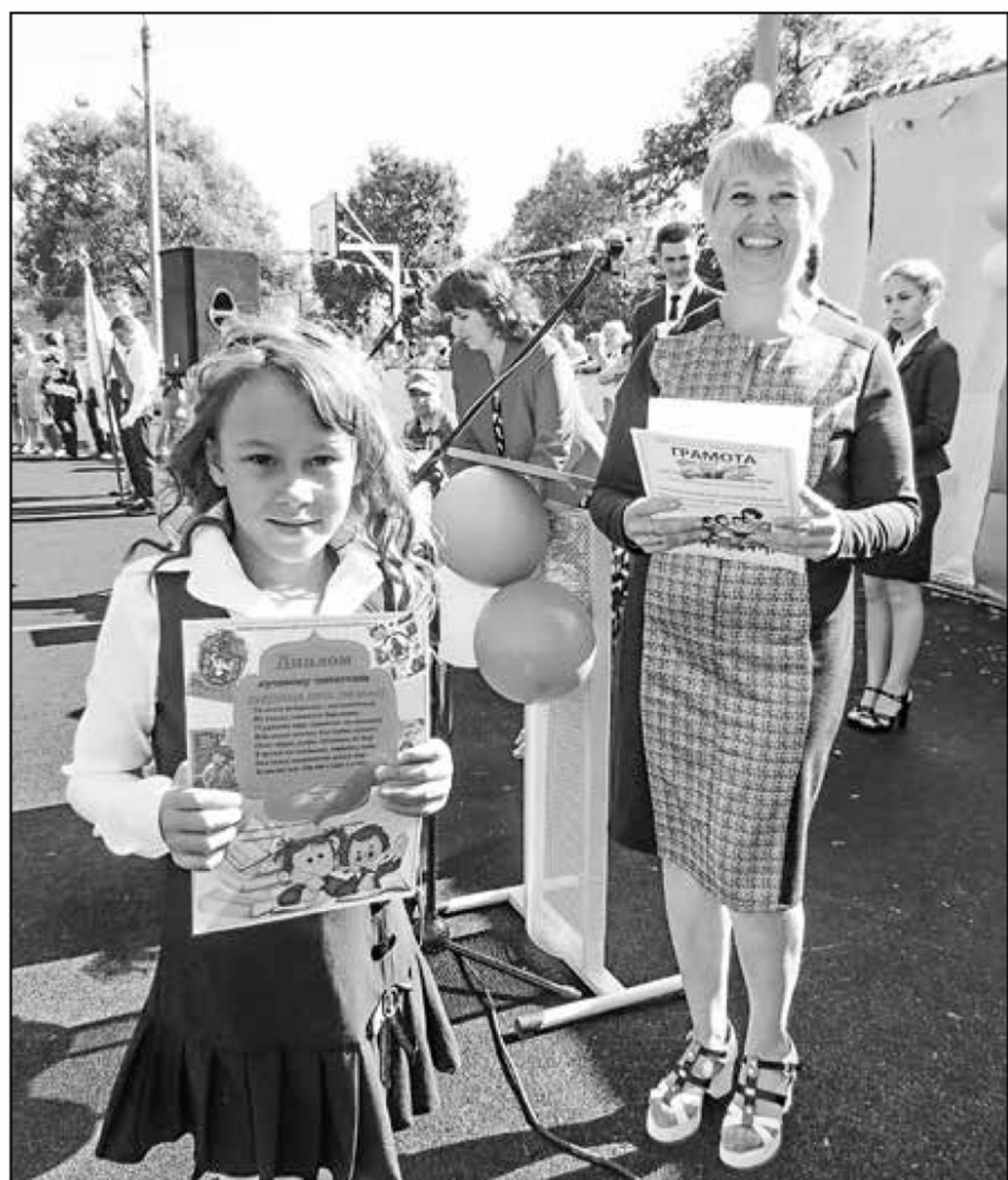
■ Вручение дипломов «Лучший читатель детской библиотеки» на школьной линейке 1 сентября

При подготовке ежегодных программ Летних чтений мы учитываем интересы ребят, их возрастные особенности, социальный статус. Есть особо значимые даты, которые включаем в программу ежегодно. К примеру, в Пушкинский день наши ребята совершили однажды виртуальную экскурсию в Болдино: «прогулялись» по любимым местам поэта, полюбовались природой, вдохновившей его на создание гениальных произведений, вспомнили все сказки Александра Сергеевича, отвечая на вопросы видеовикторины. Лучшие знатоки природы, эрудиты и «читайки» получили дипломы победителей и сладкие призы. Никто не остался без подарка и по резуль-