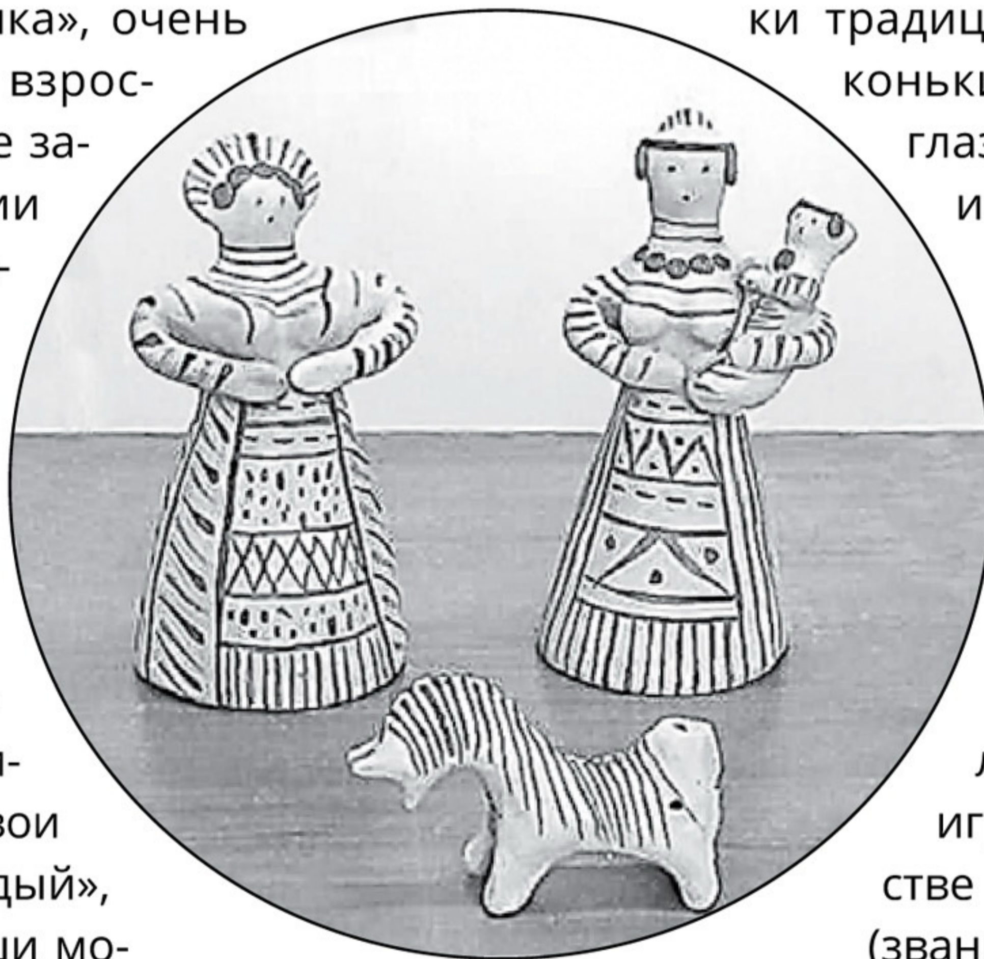
■ Чернышенская игрушка