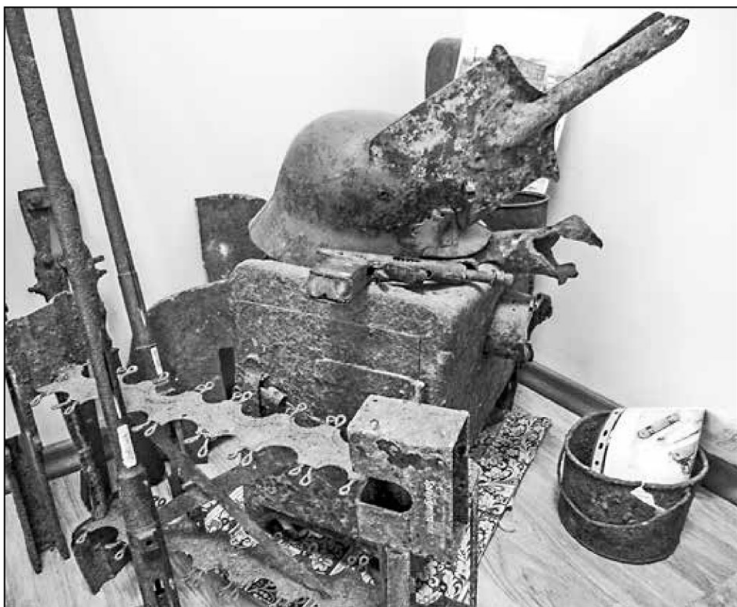
■ Экспонаты Историко-культурного центра с. Вяжи — немые свидетели боёв в ходе прорыва немецкой обороны в 1943 г.

— Наша детская библиотека предоставляет возможность насладиться чтением всем желающим: дошколятам, первоклассникам, подросткам, молодёжи, а также взрослым — мамам, папам, бабушкам и дедушкам. Дошколята любят русские народные и зарубежные сказки, младшие школьники — стихи классиков и современных детских поэтов, рассказы о животных Б. Житкова, Н. Сладкова, Е. Чарушина, В. Бианки. Подростки охотно берут книги энциклопедической серии «Я познаю мир», детективной серии «Чёрный котёнок», рассказы М. Зощенко, И. Пивоваровой. Молодёжь читает произведения современных авторов — Э. Веркина, Дж. Роулинг, Д. Емеца, В. Роньшина, Е. Вильмонт, приключенческую серию «39 ключей». А вот взрослых как раз больше всего интересует тема подвига в годы Великой Отечественной войны, а также деревенские сюжеты, поэзия и проза Орловского края.