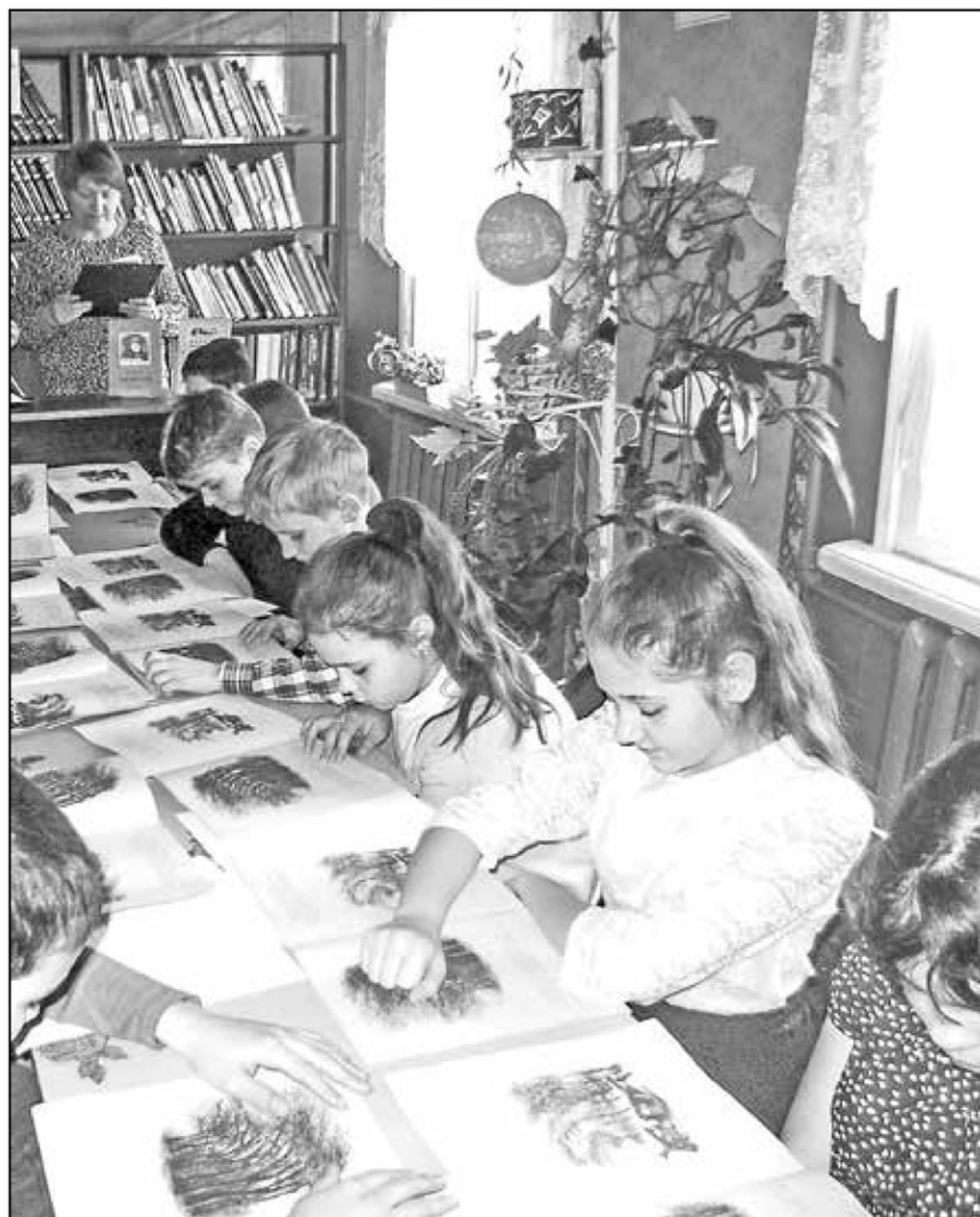
■ Громкие чтения рассказа М. Горького «Воробышко» в рамках межрегиональной акции к юбилею писателя