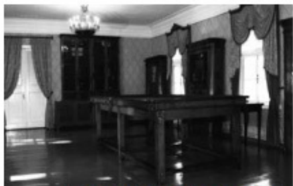
Библиотека в Спасском-Лутовиново

шкафа две громадные книги. Одну он отдал своему соучастнику, который поспешио унёс её к себе, а другую спрятал под лестницей. Долго не мог уснуть в ту ночь маленький похититель, с нетерпением дожидаясь утра: так хотелось ему узнать, какие диковинные книги извлёк он из заветного шкафа.