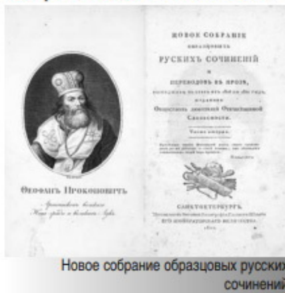
Новое собрание образцовых русских сочинений

Пользовался популярностью журнал «Патриот», издававшийся в 1804 г. поэтом, прозаиком, переводчиком, журналистом В. В. Измайловым, в котором публиковались повести и рассказы для детей и уже известные авторы — А. Беркен, С. Ф. де Жанлис, из поэтов —