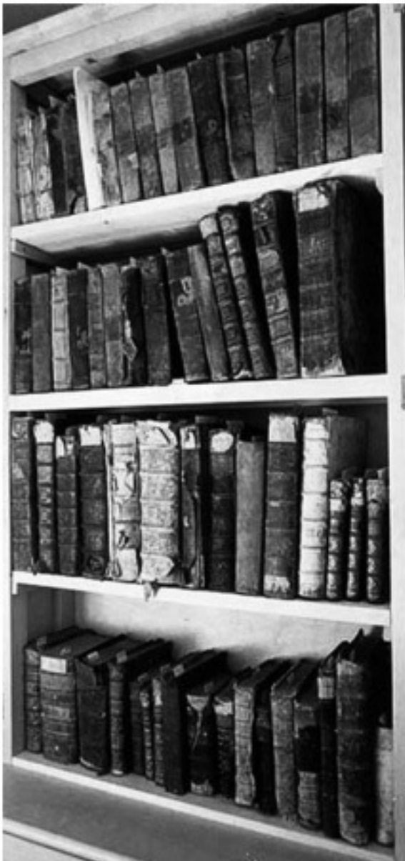
Книги из библиотеки И. С. Тургенева

В журнале печатались переводы из сочинений Ш. Бонне, Х. Ф. Вейсе, С. Геснера, Д. Томсона, весьма популярной в