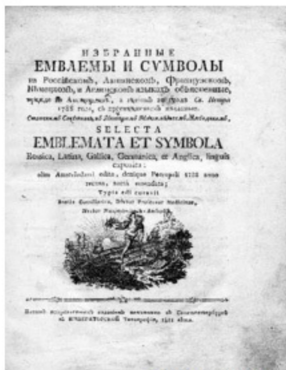
«Эмблемы и символы»

Спрятанный под лестницей огромный фолиант оказался «Книгой символов и эмблем», а другой, унесённый Серебряковым, — «Россиада» Хераскова» 1 .