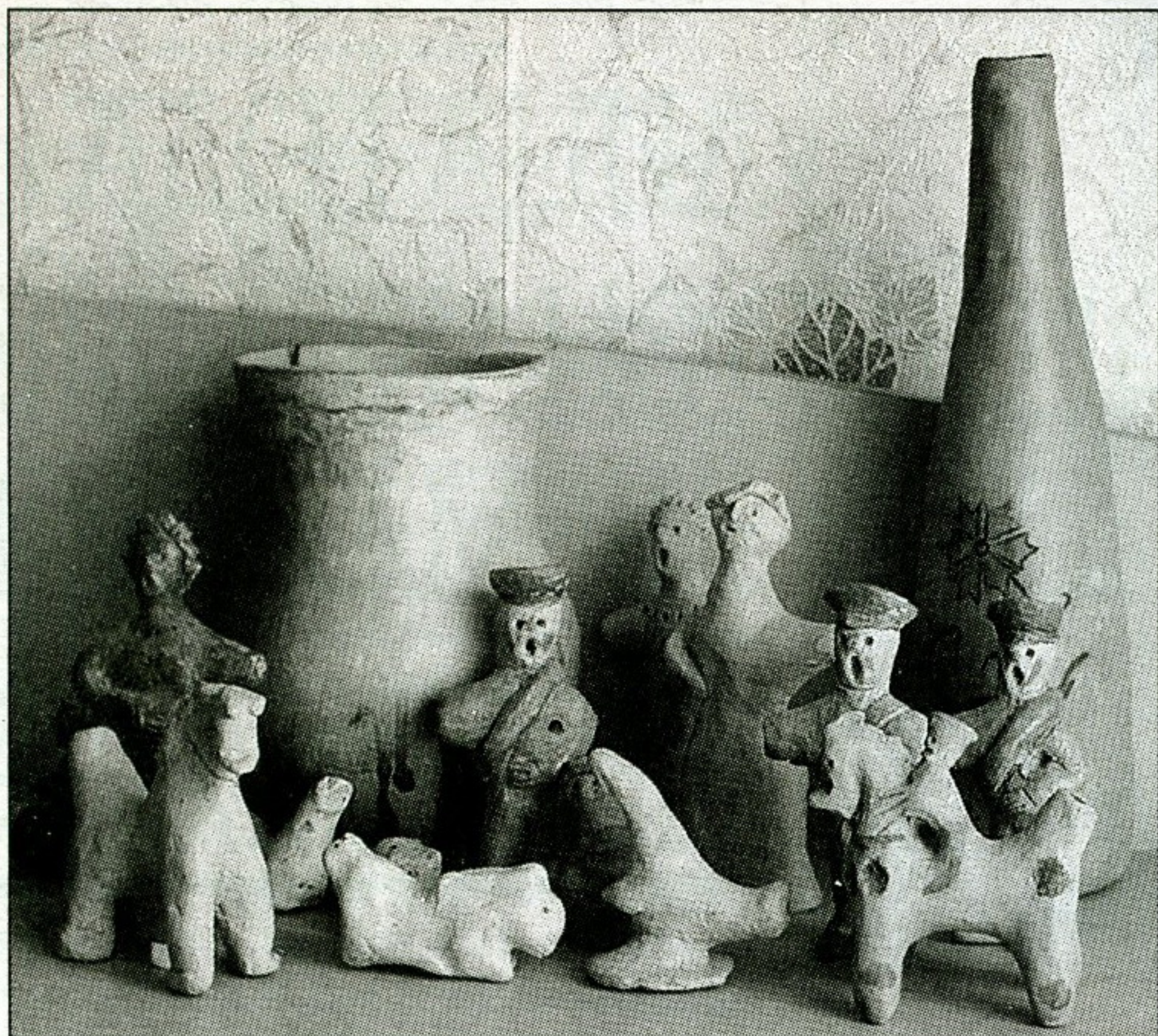
Так выглядит самобытная плешковская игрушка