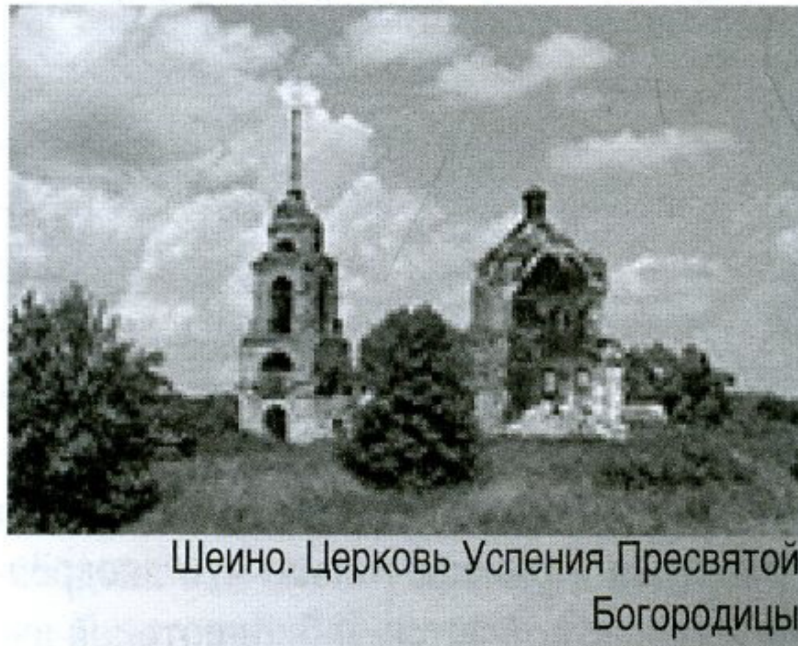
Шеино. Церковь Успения Пресвятой Богородицы

Обилие значимых не только для Мценского района памятных исторических и литературных мест, мест воинской доблести даёт поистине неограниченные возможности для учреждений социальной сферы по воспитанию у жи-