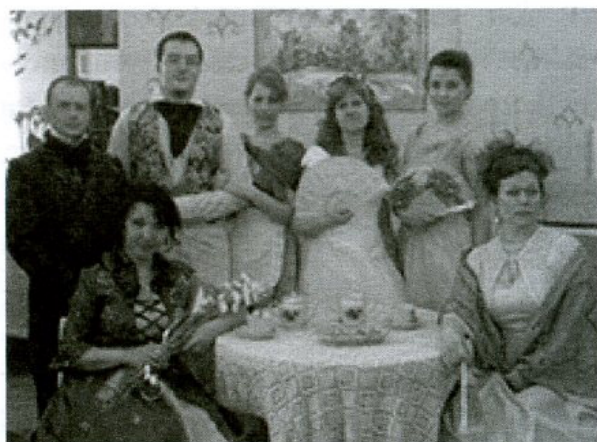
Участники театра книги, Мценский район

Коллективы детской и взрослой библиотек связывают узы тесного творческого сотрудничества — согласимся, что даже в нашей изначально доброжела-