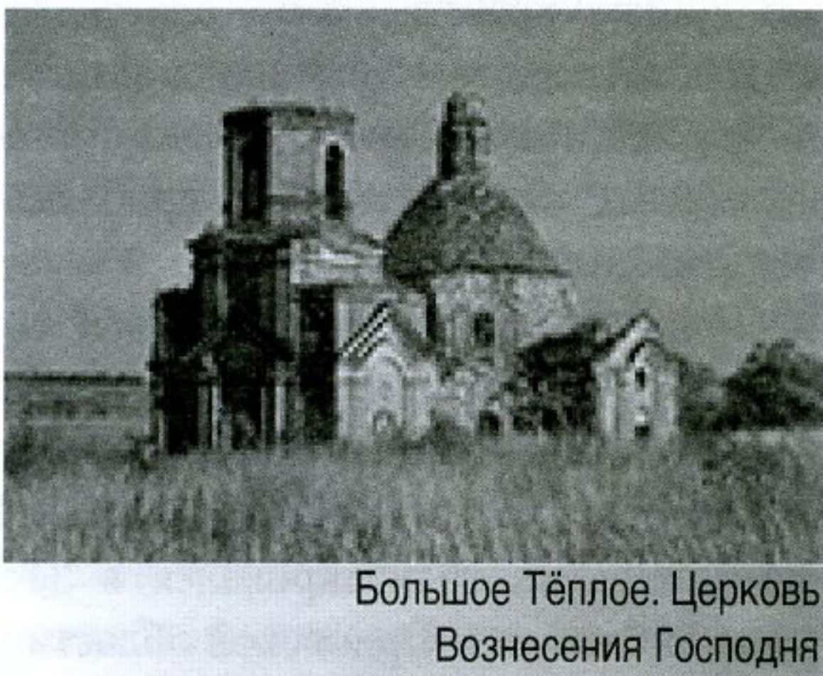
Большое Тёплое. Церковь Вознесения Господня

телей чувства патриотизма, развитию их исторического и гражданского мышления. Этой социально значимой работой целенаправленно занимаются, прежде всего, учреждения культуры, в частности, библиотеки. Позиционируя