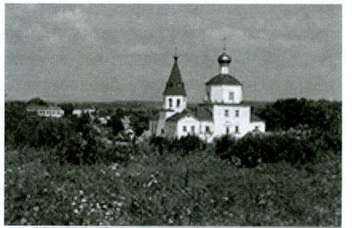
Церковь Вознесения Господня в Мценске

В 1974 г. библиотека меняет свой адрес и переезжает в новое здание по улице Гагарина. Через некоторое время