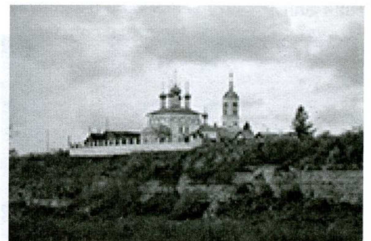
Церковь Введения во храм Пресвятой Богородицы