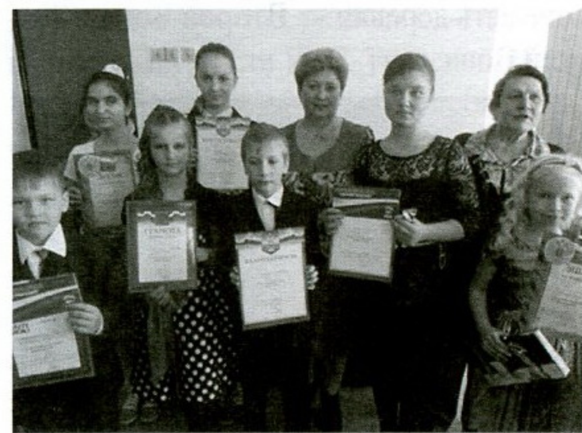
Мценский районный праздник Королева Книга приглашает

Работники библиотеки — частые гости в общеобразовательных школах,