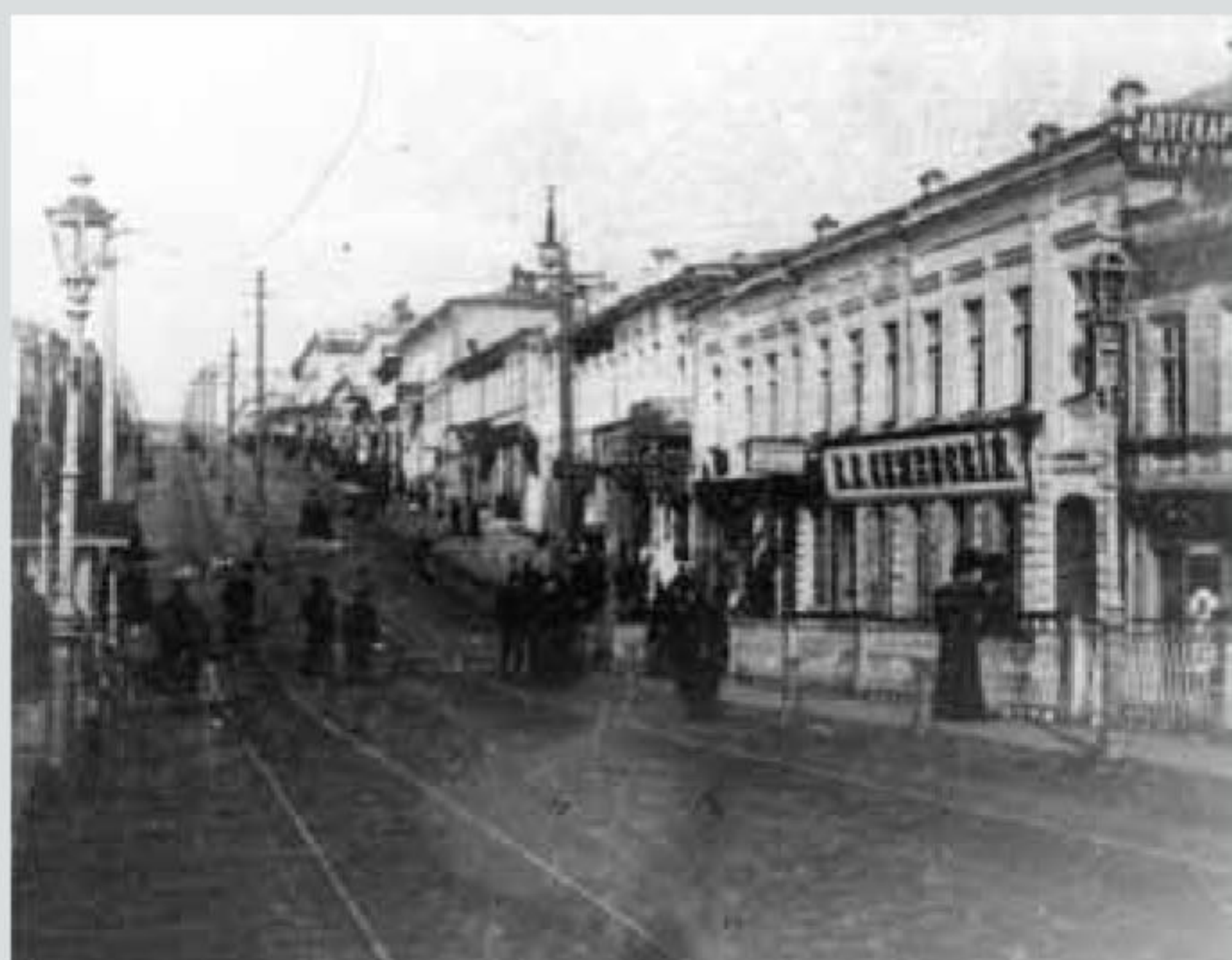
Старый г. Орёл. Улица Болховская

первые трамвайные линии. К этому времени, по воспоминанию орловского краеведа Гавриила Михайловича Пясецкого , Болховская улица стала излюбленным местом для «первостатейных» орловских купцов, поскольку на ней расселилась практически вся городская знать.