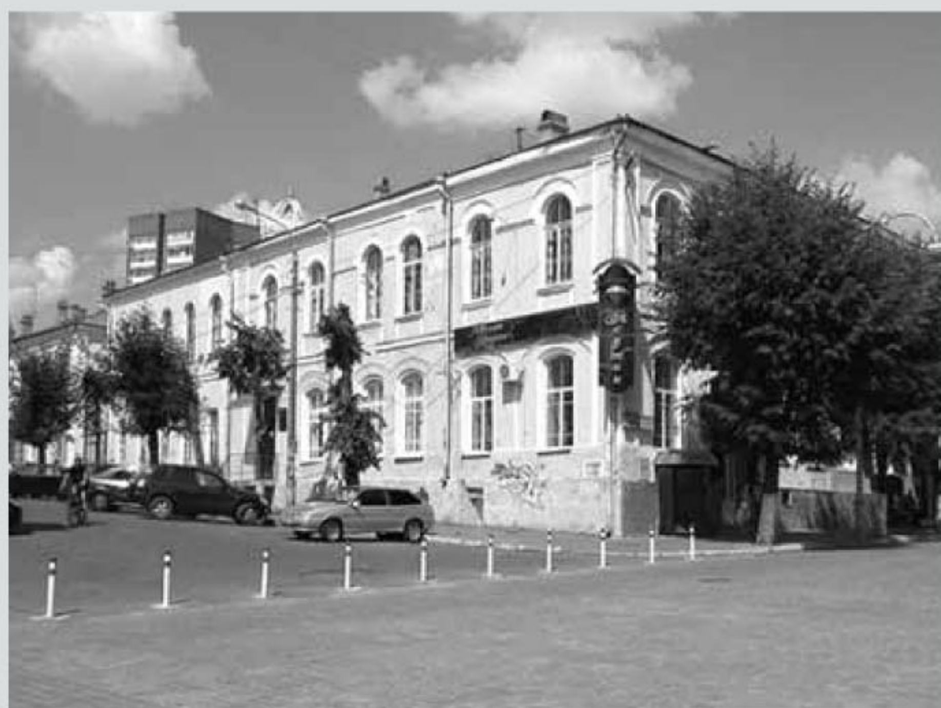
Современная улица Ленина (бывшая Болховская)