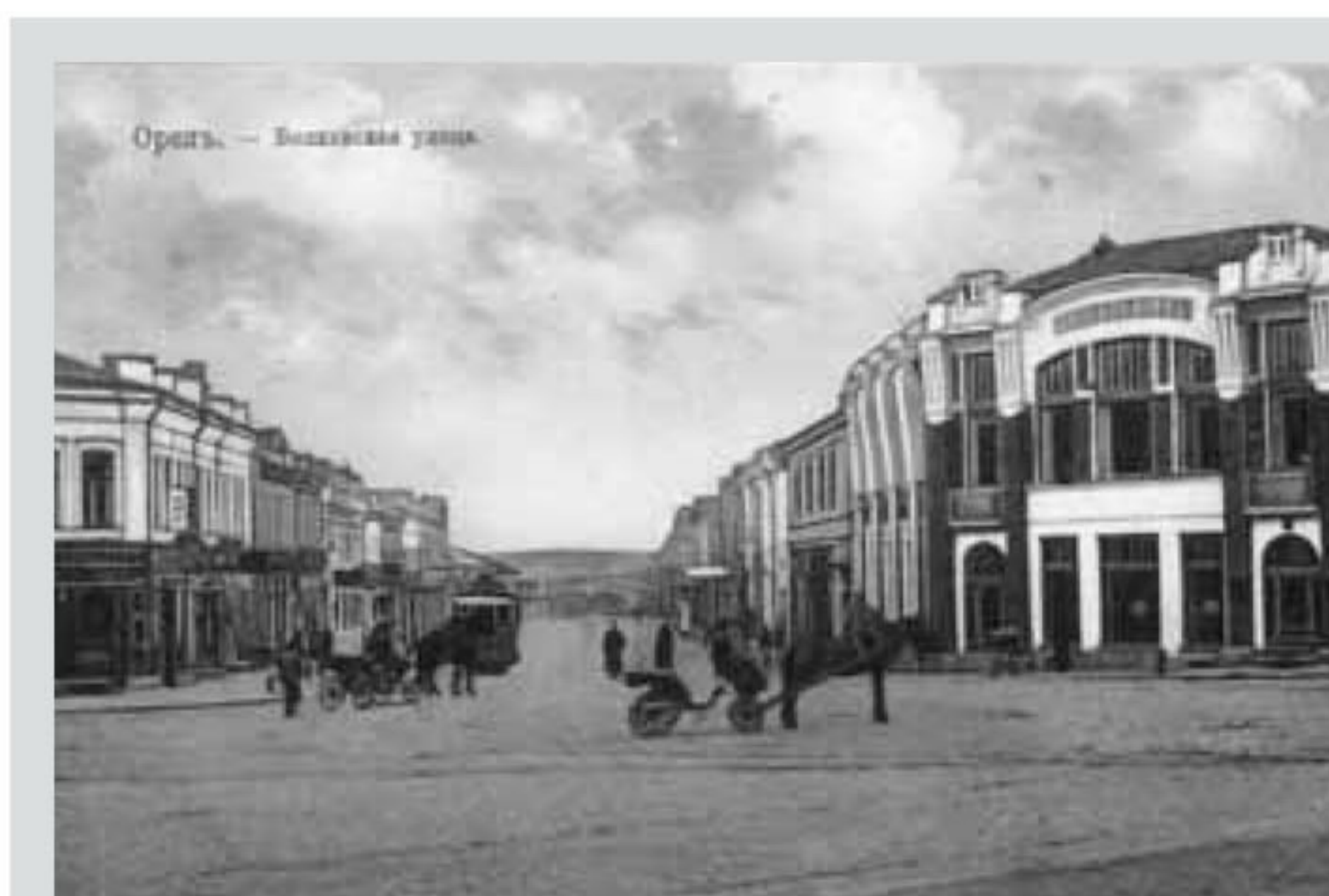
Открытка начала XX века. Надпись: «Орель. – Болховская улица.»

В архитектуре зданий, расположенных на этой улице, преобладают стили классицизма, барокко и модерна. В начале — середине XIX века на улице Болховской появилась первая в Орле каменная мостовая, первый в городе кинематограф и первая фотостудия,