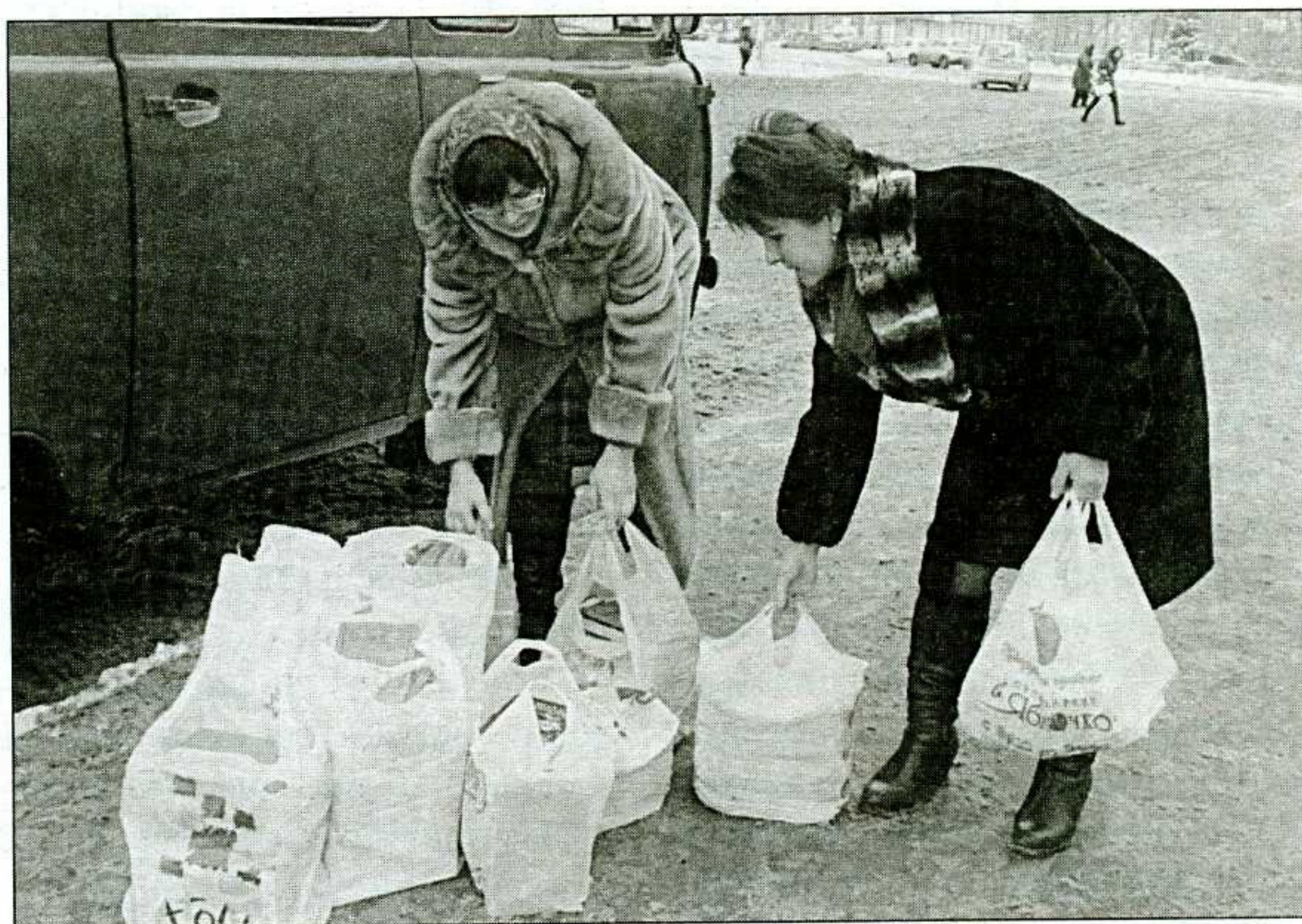
● Библиотекари привезли очередную партию изданий для акции «Книга в дорогу»

Итак, для начала мы отправились на железнодорожный вокзал, чтобы по примеру московских коллег договориться об установке полок или стеллажей. Мы планировали регулярно пополнять их книжками. Но, к сожалению, начальник вокзала отнёсся к идее скептически.