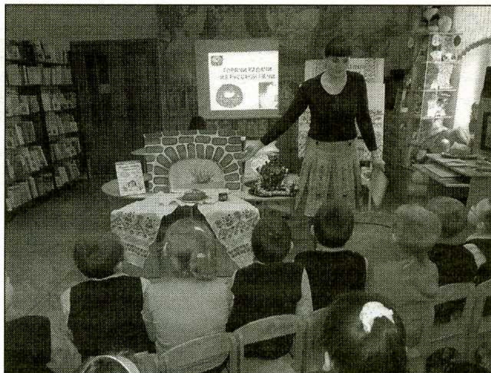
Летний проект «С книжкой на скамейке»

В честь дня рождения замечательного писателя Самуила Маршака в библиотеке построили его знаменитый Кошкин дом. После известного всем пожарного происшествия он стал крайне гостеприимен. Тётя Кошка принимала сегодня не только своих племянников, но и других живущих по соседству героев стихов: и Глупого Мышонка, и Умного, и Ваньку-Встаньку, а один герой прямо выскочил из книги. В зале появился чудак, который, как выяснилось, живёт на Бассейной улице. На кровати утром сел, в брюки ноги он продел.