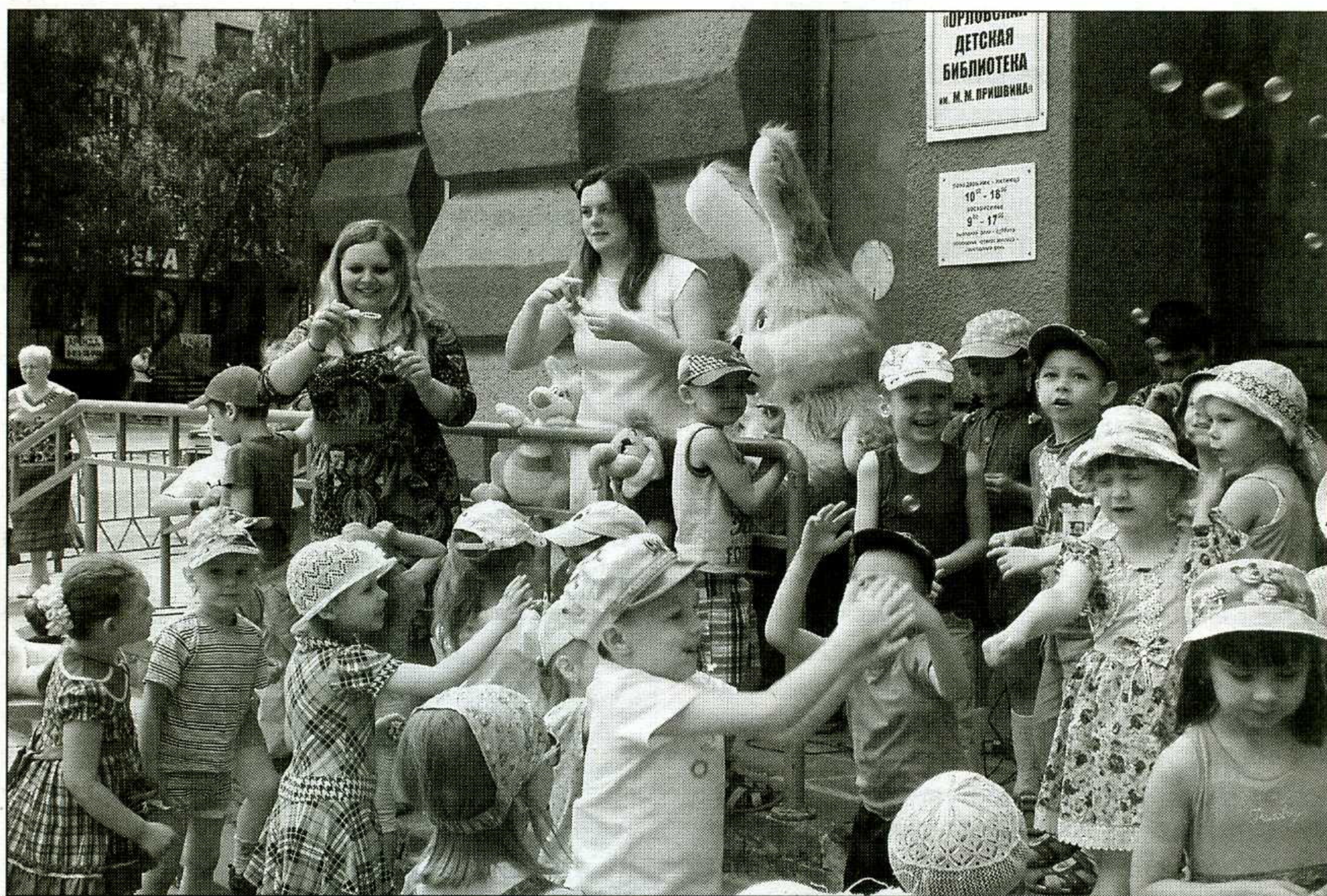
Весёлое развлечение — ловить мыльные пузыри

Ребёнка нужно постоянно удивлять и радовать — только в этом случае возможно истинное сотрудничество и сотворчество библиотеки, детей и родителей.