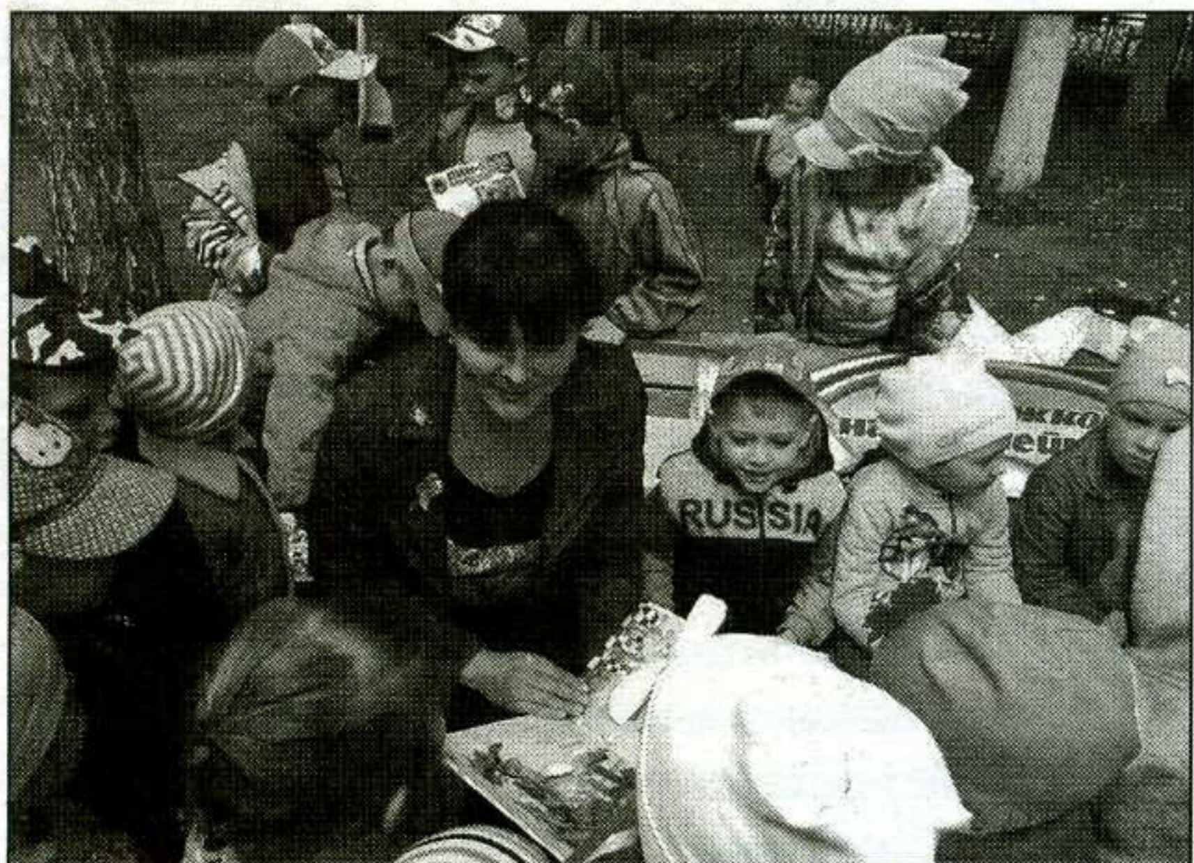
Очень нравится детишкам игра «Угадай, кто ты»

На словах и действиях участников построены словесные игры: кроссворды, шарады, перевёртыши, ребусы, загадки с рифмами невпопад, пословицы.