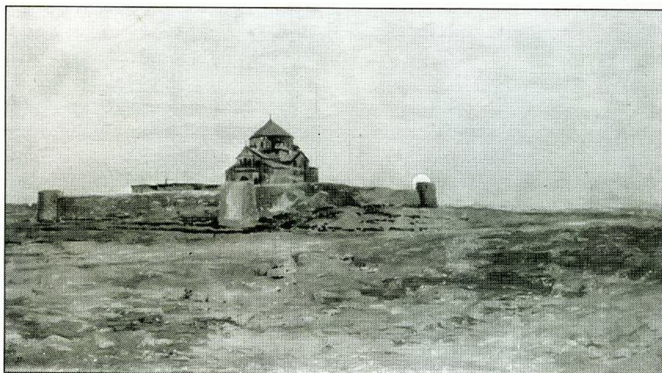
Церковь Святого Рупсине близ Эгмиадзина. Художник В.А. Суреняну. 1897 г.

Арамазда, прорицатель судьбы, открывающий людям будущее в снах. Существо из армянской мифологии.