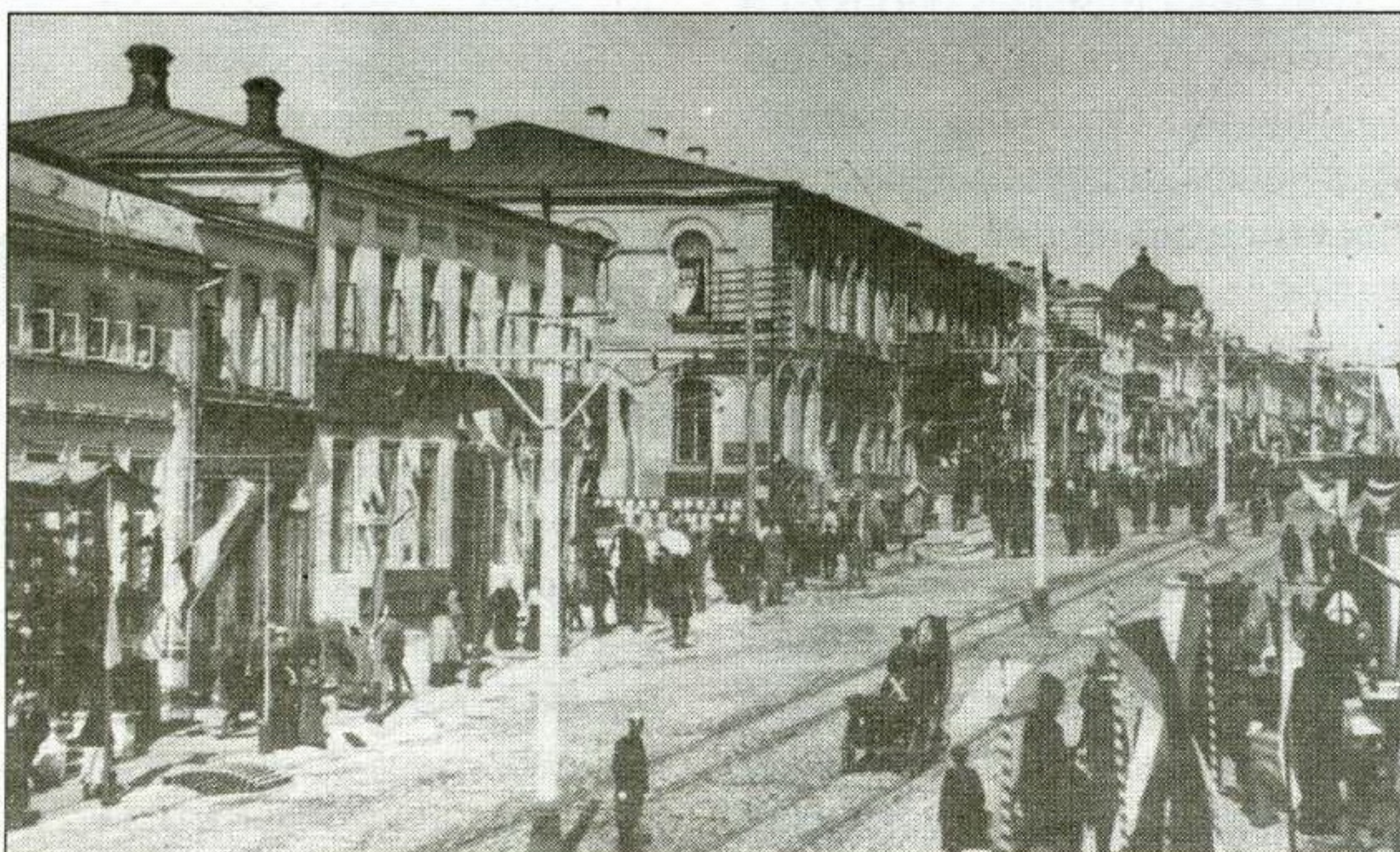
● Болховская упоминается в произведении «Загадочный человек» Н. ЛЕСКОВА

Дом № 19 привлекает краеведов своим богатым историческим прошлым. В конце 1850-х гг., в пору работы над