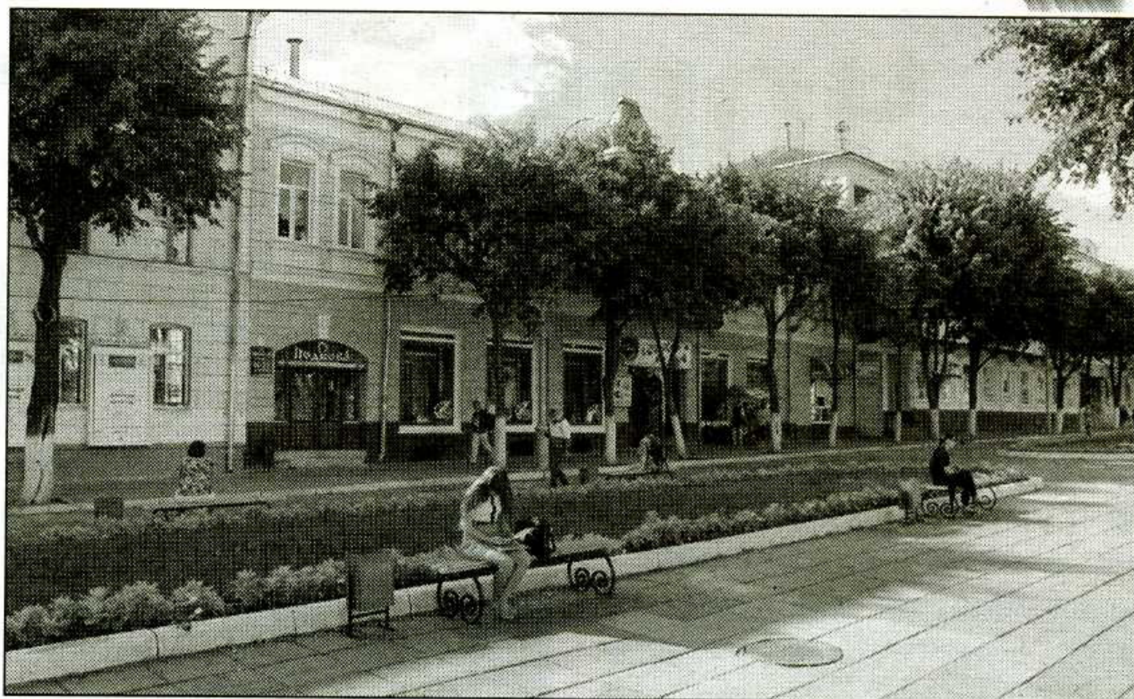
● Бывшая Болховская, а ныне улица Ленина — излюбленное место отдыха жителей Орла

Такая была она, Болховская улица: многоликая и суетная, но всё же уютная и притягивающая обывателей с окраинных улочек города. Её неуловимым ритмом рождены лиричные строки И.А. Бунина, которые он написал в далёкой Франции, вспоминая