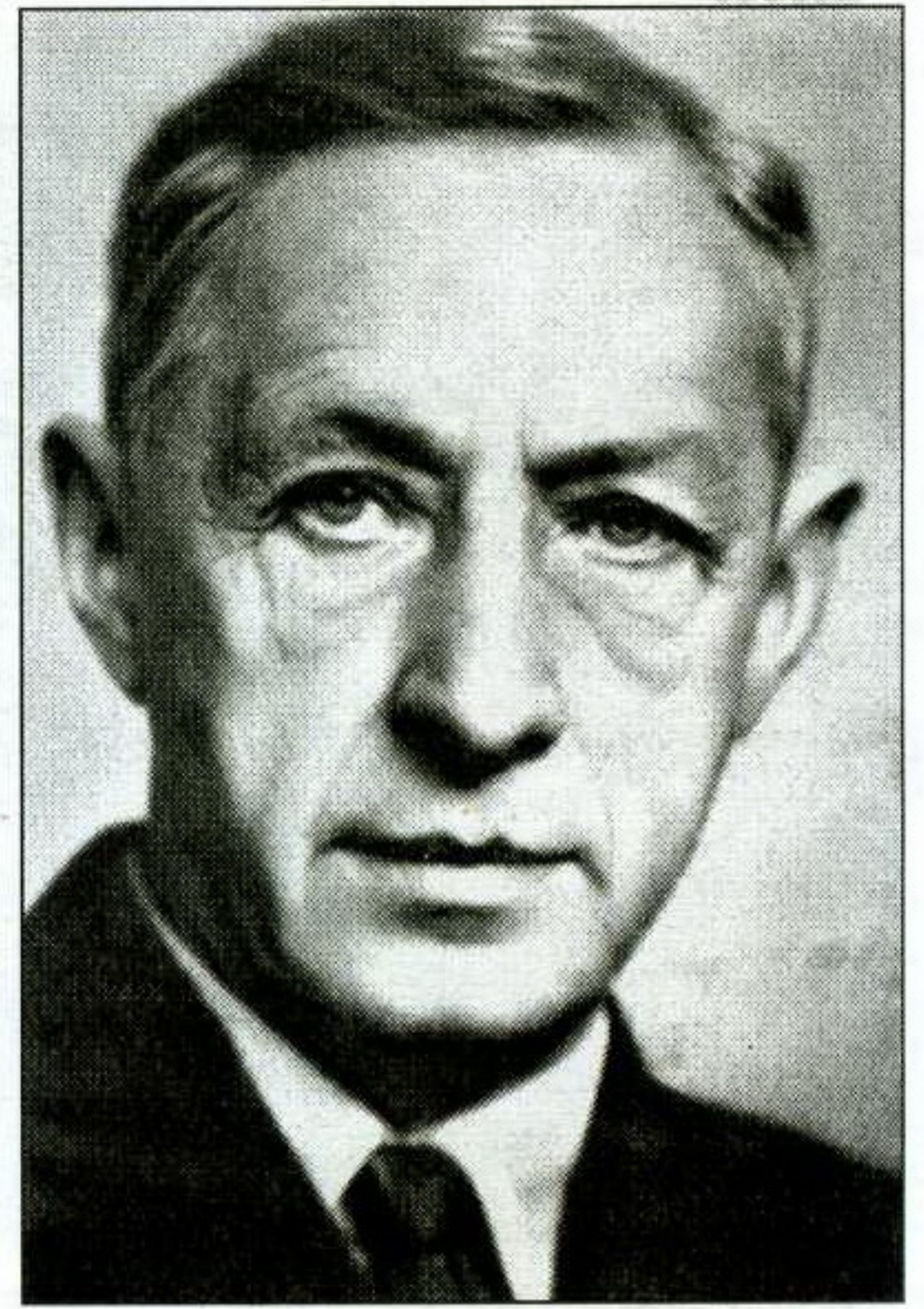
● И. БУНИН

Сегодня на улице Ленина находится более 20 зданий, получивших статус архитектурных памятников. Среди них наибольший интерес представляет дом № 19, построенный в 1857 г. В нём была открыта гостиница, а её первой хозяйкой стала купчиха Е.К. Иордан. Затем в 1870-х гг. особняк перешёл во