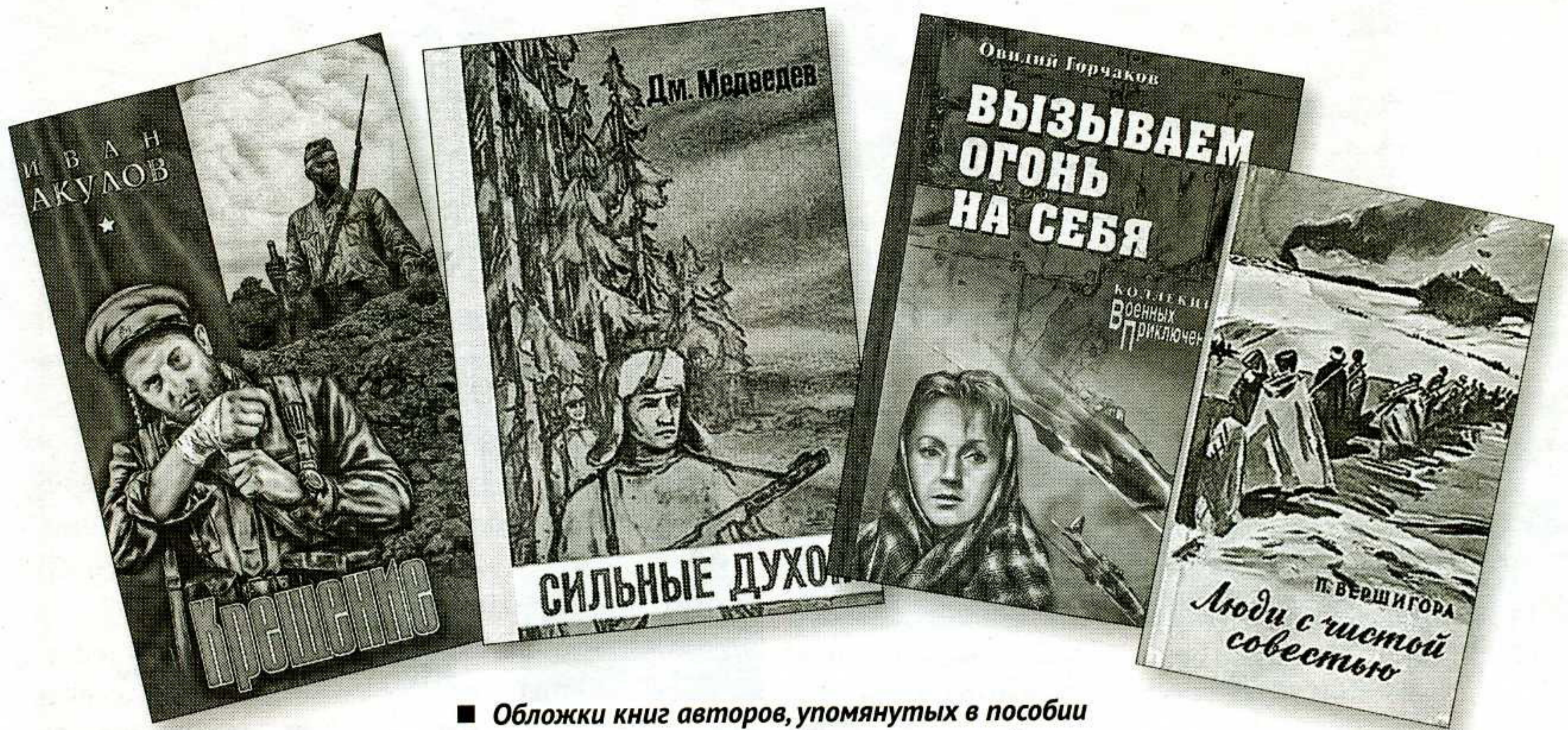
■ Обложки книг авторов, упомянутых в пособии

ния — образ реально существовавшего человека, Героя Советского Союза Н.И. Кузнецова.