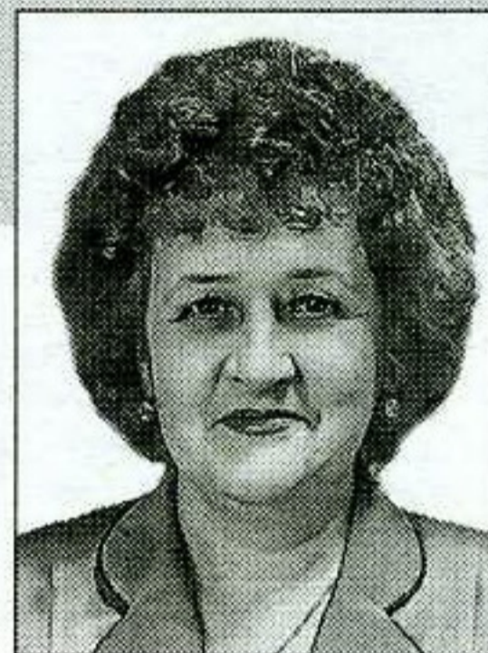
Орловская детская библиотека имени М.М. Пришвина