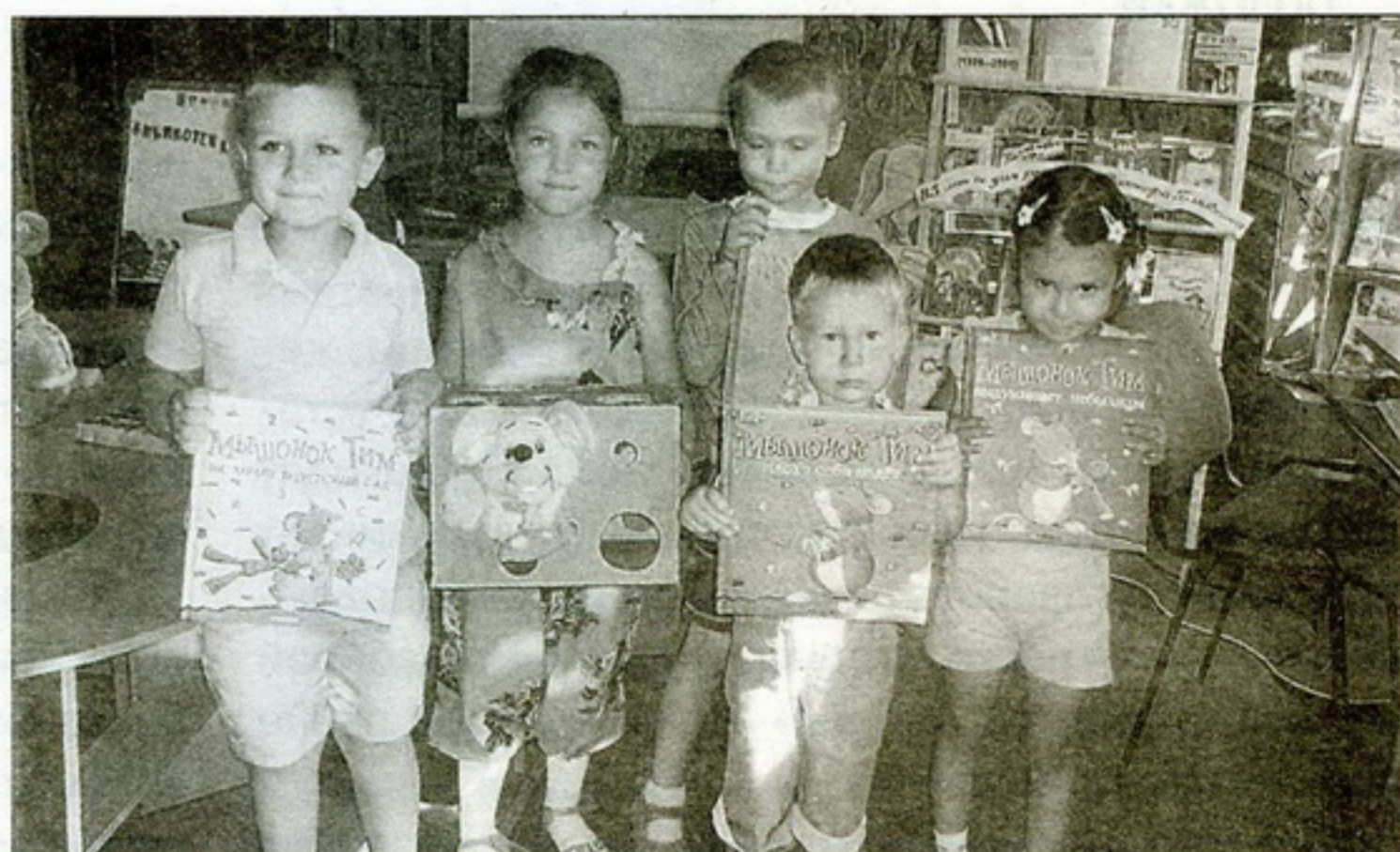
В Мышином царстве-государстве