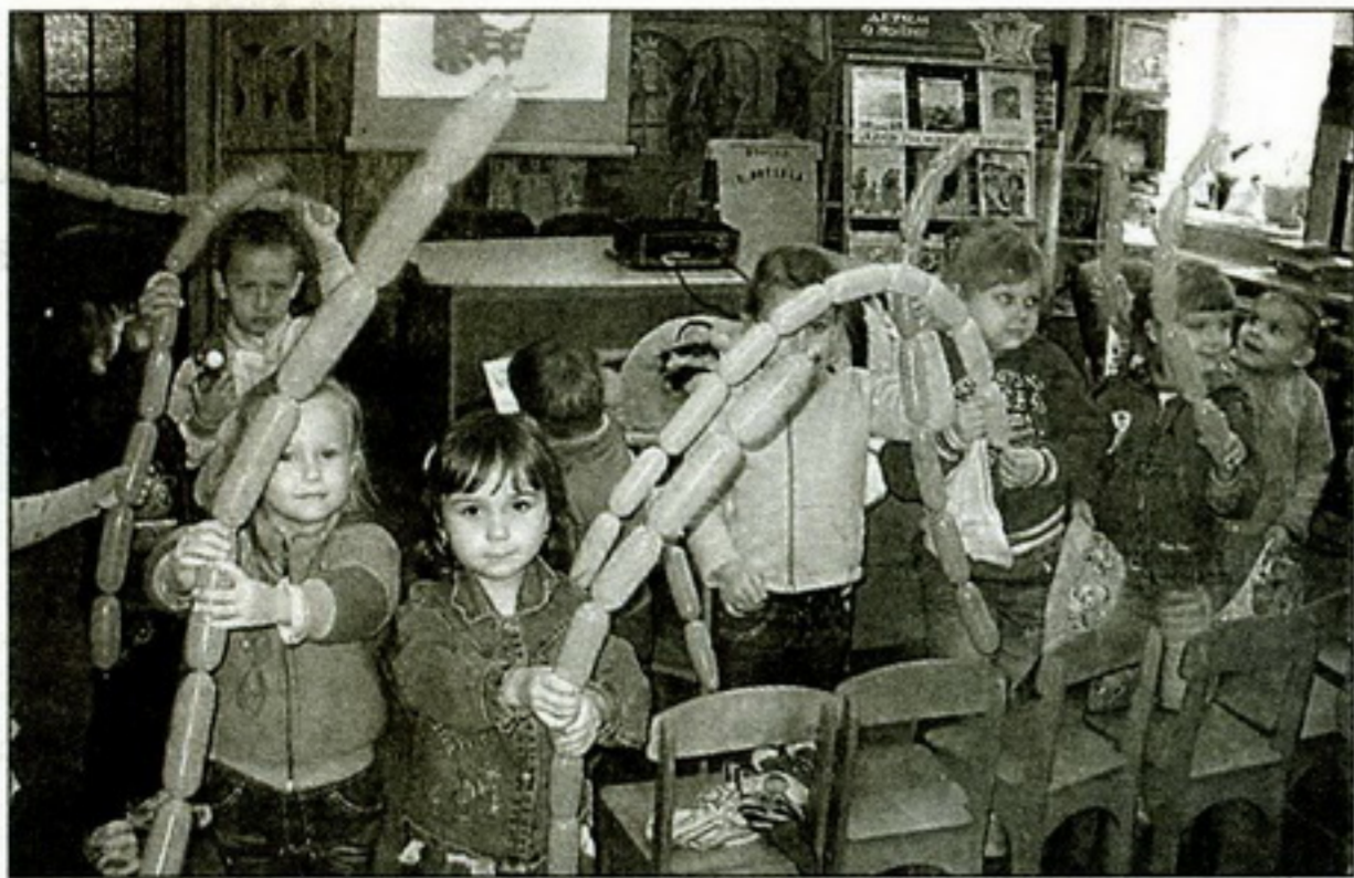
«Сосиски» для нашей кошки

нали, что в природе обитают наши ближайшие родичи, которые сильнее и больше льва; что другие могут быть размером с ладошку; что существуют поющие обезьяны и даже полуобезьяны (лемуры).