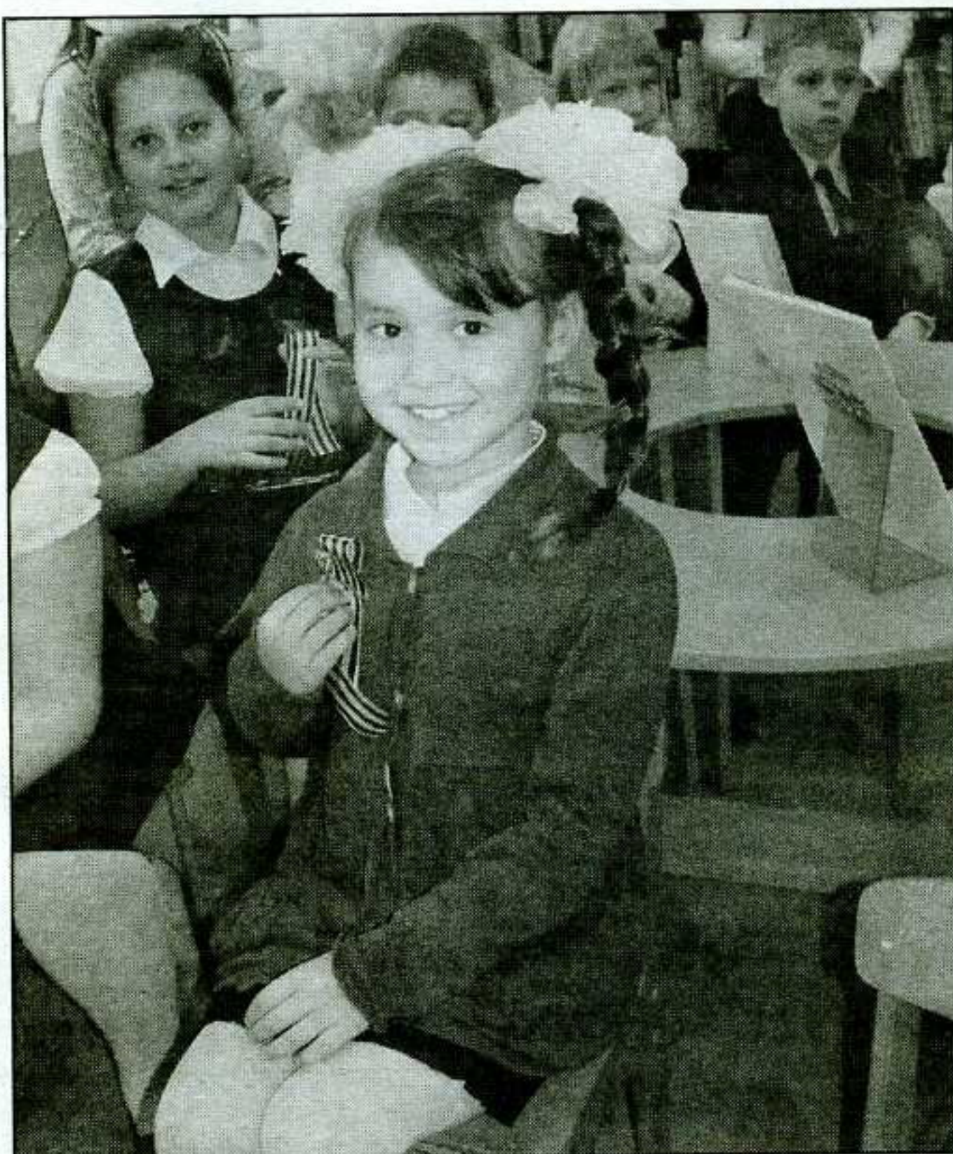
Акция «Читаем детям о войне» в отделе обслуживания дошкольников и учащихся 1-4-х классов

Итогом сотрудничества нашей библиотеки и музея «Зеркало истории» лицея № 18