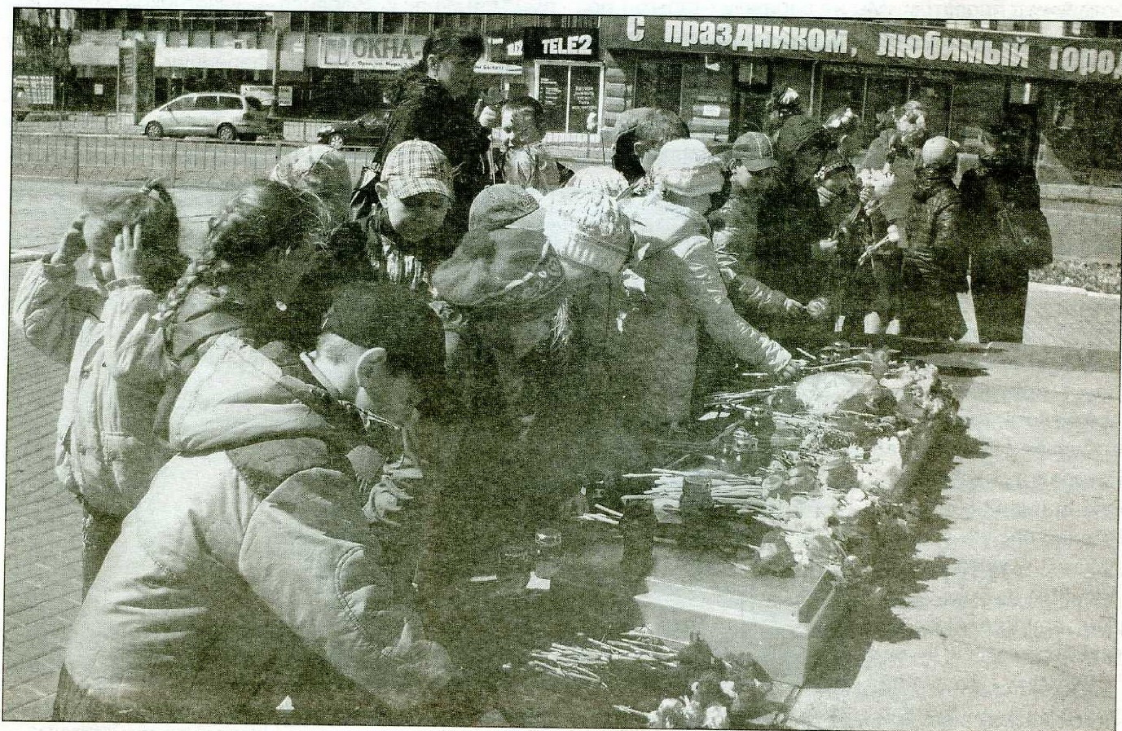
Читатели возлагают цветы к памятнику танкистам — освободителям г. Орла

Новое поколение нуждается в планомерной воспитательной работе, которую наряду с семьёй и школой должна проводить детская библиотека.