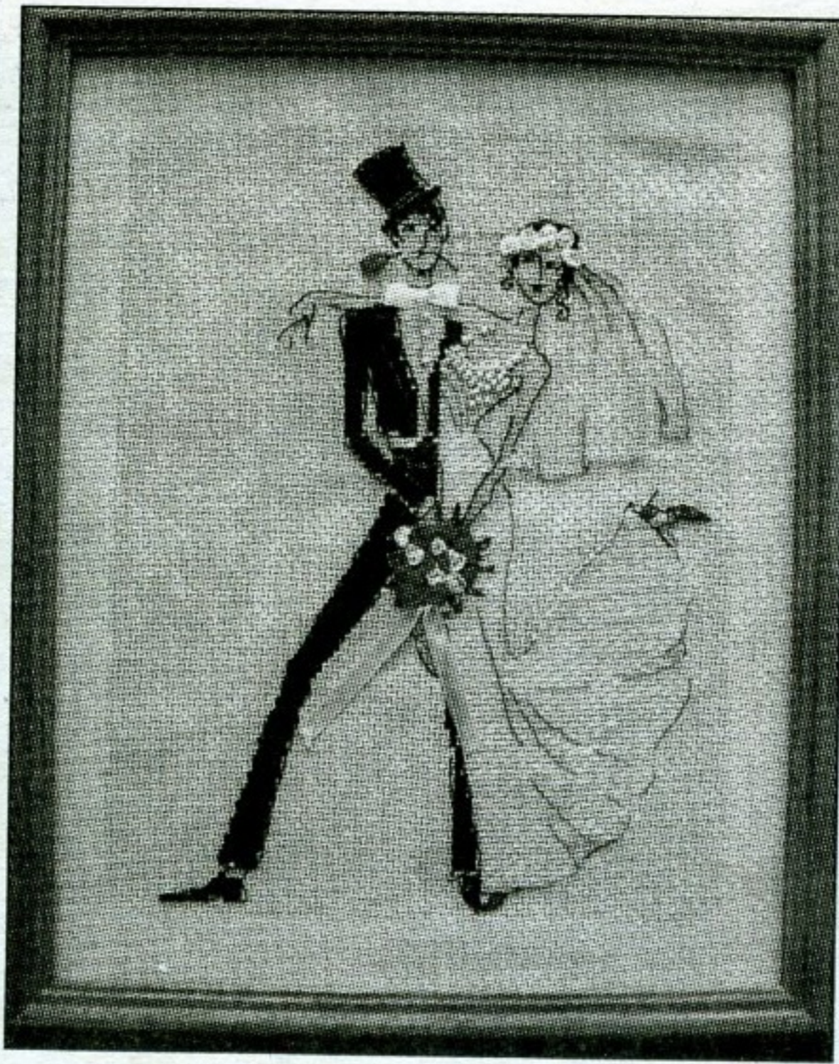
Вышивка библиотечных мастериц