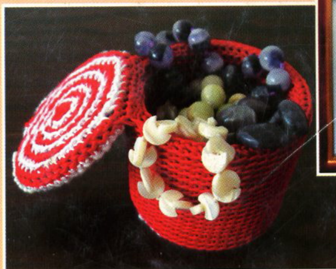
Вязаная шкатулка работы Г. ПЕТРОВОЙ