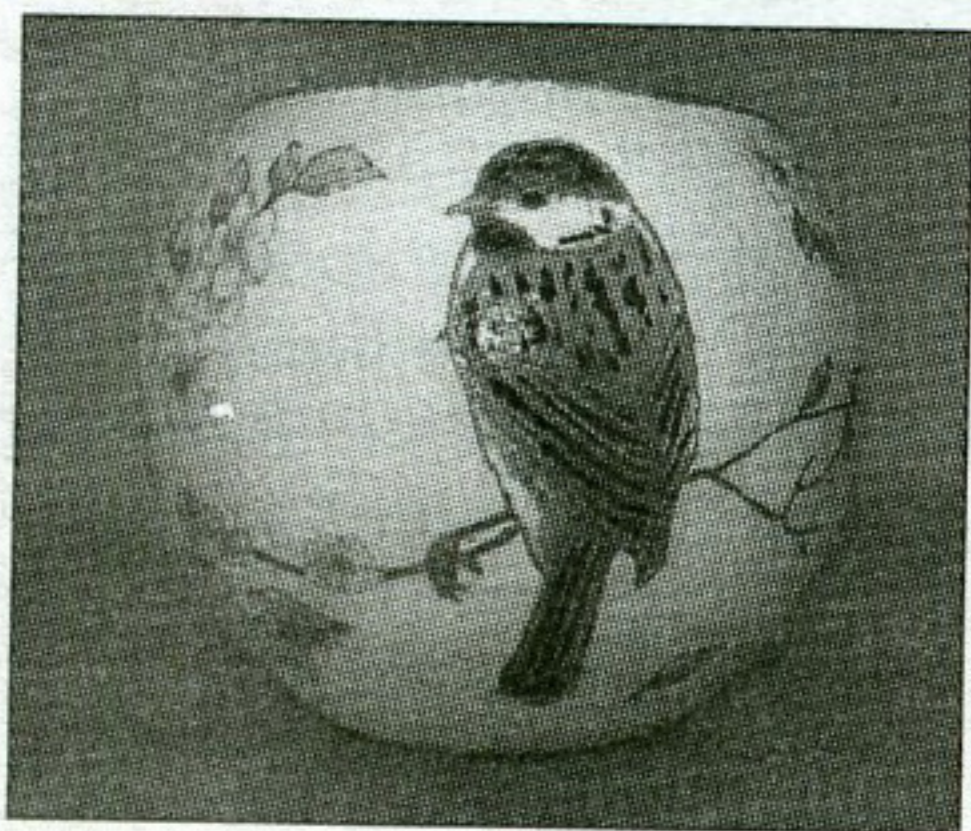
Декупажи Ю. КАРПОВОЙ