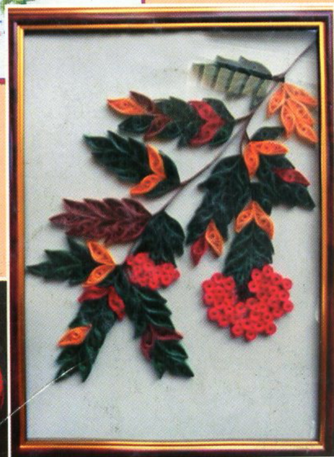
Картина в технике квиллинга. Мастер Т. ЖИХОРЕВА