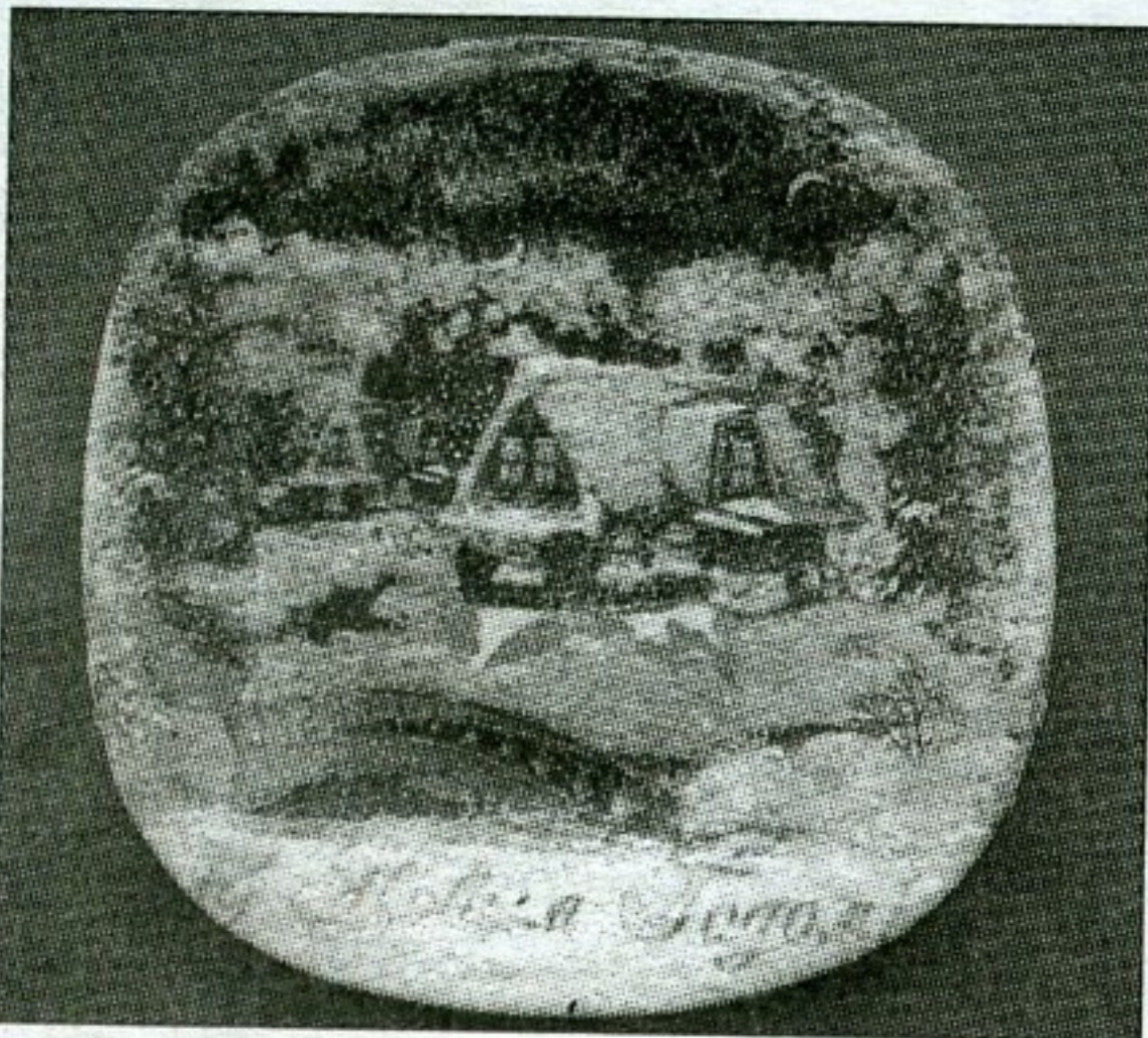
Декоративная тарелка «Новый год»