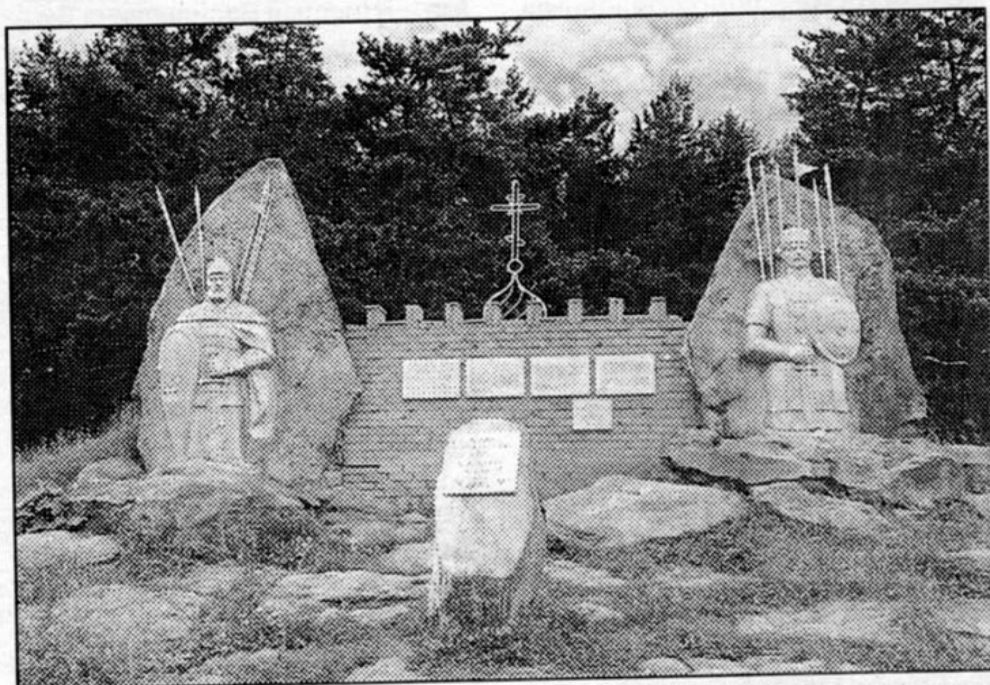
● Мемориал в с. Судбищи, посвящённый битве с Девлет-Гиреем