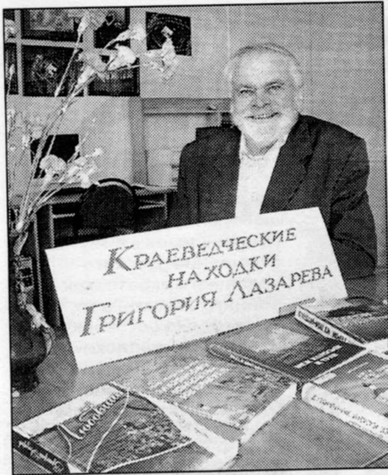
● Автор представляет свои произведения, посвящённые истории Орловской области