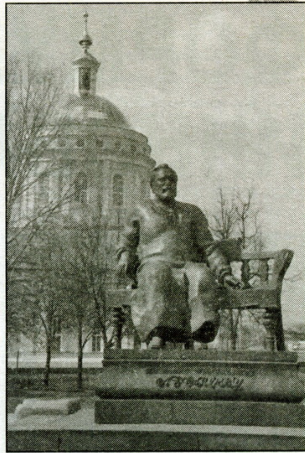
● Памятники знаменитым орловцам А.А. Фету, И.С. Тургеневу, Н.С. Лескову