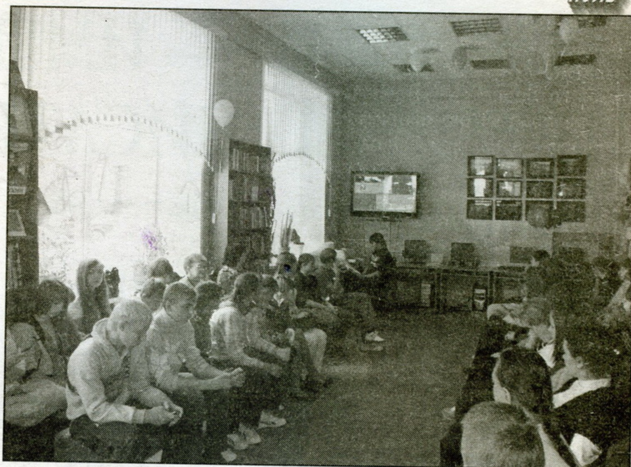
● Презентация энциклопедии вызвала большой интерес у детской аудитории

Анатолий Брянчанинов переложил на стихи некоторые русские народные сказки, эту работу положительно оценил в своё время Иван Сергеевич Тургенев. Работы Владимира Бурнашёва, написанные для детей, по достоинству заслужили похвалу критика Виссариона Белинского. К сожалению, произведения этих авторов в фондах библиотек нашего города отсутствуют, а нам хотелось, чтобы читатели с ними познакомились. Мы обратились в Российскую национальную библиотеку в Санкт-Петербурге, и коллеги предоставили нам копии сочинений писателей. Все читатели и пользователи электрон-