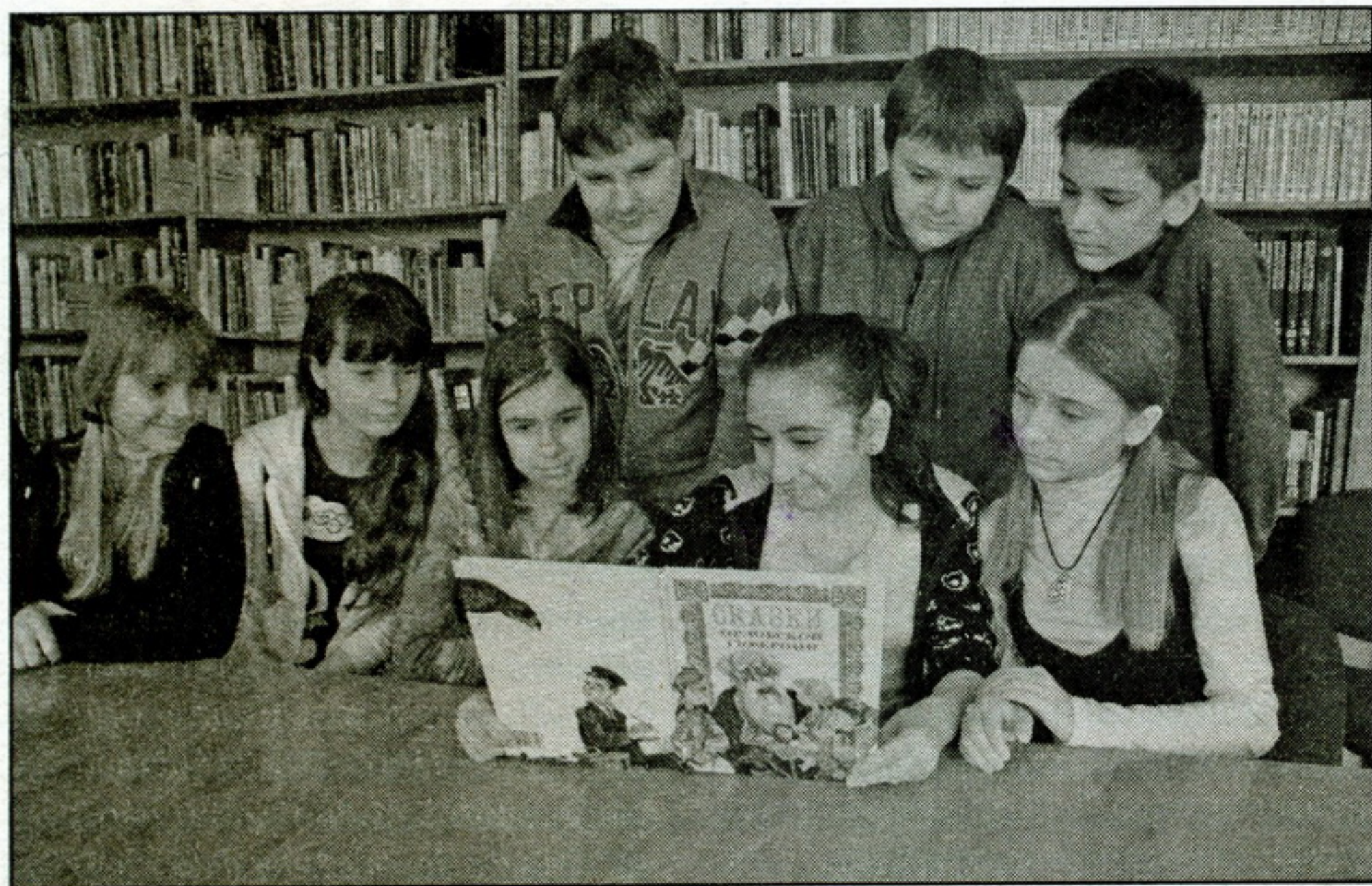
● «Сказки Орловской губернии» уже дошли до адресата

Сегодня электронный проект «Орловские писатели — детям» доступен для пользователей на компакт-диске, а в ближайшее время этот информационный ресурс будет размещён на сайте ОДБ.