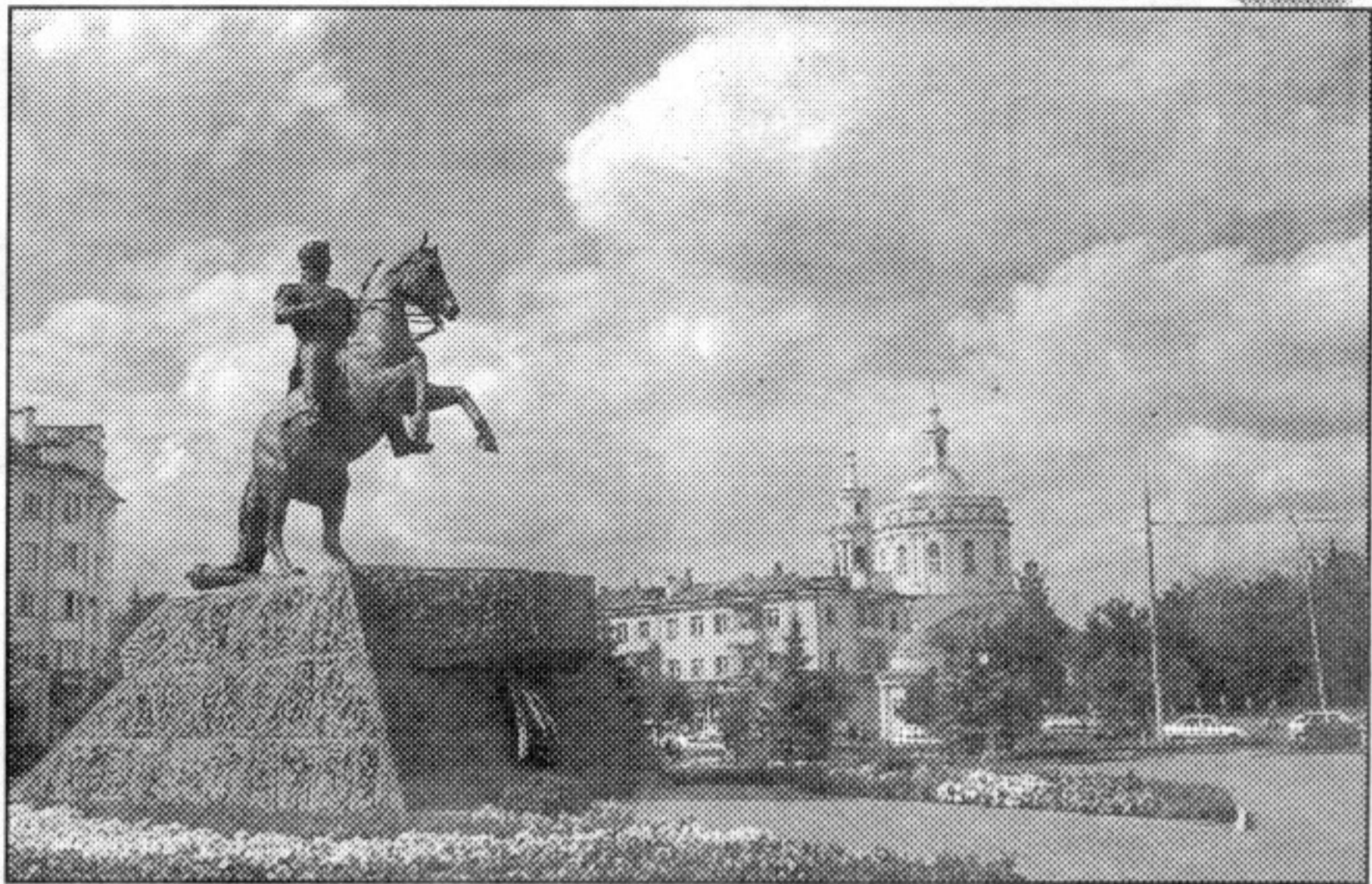
● Памятник А.П. Ермолову в Орле