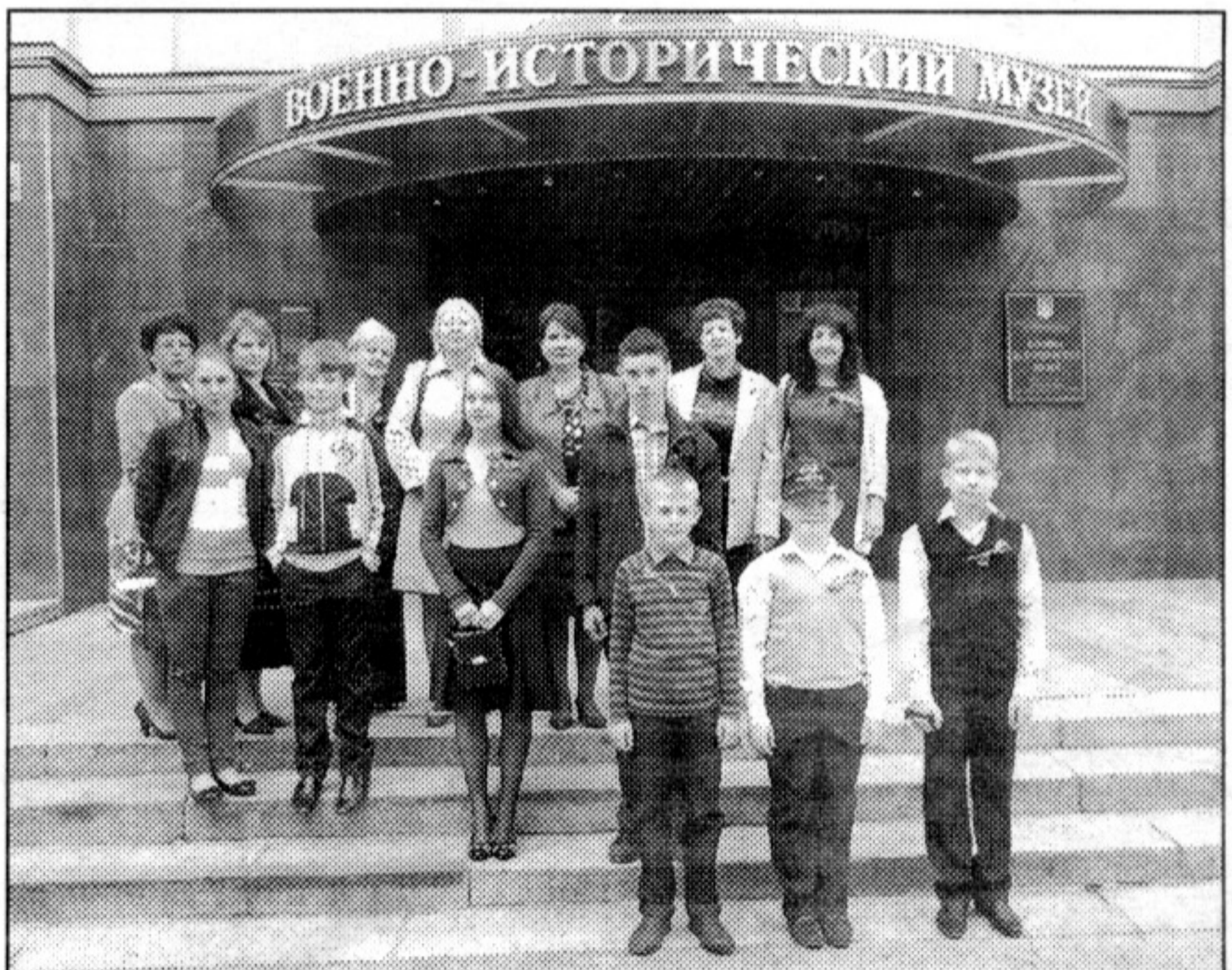
● Участники конкурса на крыльце Военно-исторического музея

К удивлению организаторов, наибольшее затруднение вызвали вопросы краеведческого характера. Увы, школьники слабо представляли себе роль Орловской губернии в событиях Отечественной войны 1812 года, с трудом вспоминали фамилии знаме-