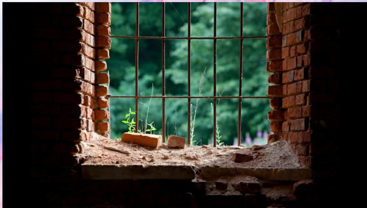
Никольская церковь села Руднево