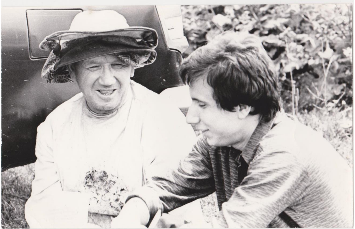
Материал об известном пчеловоде