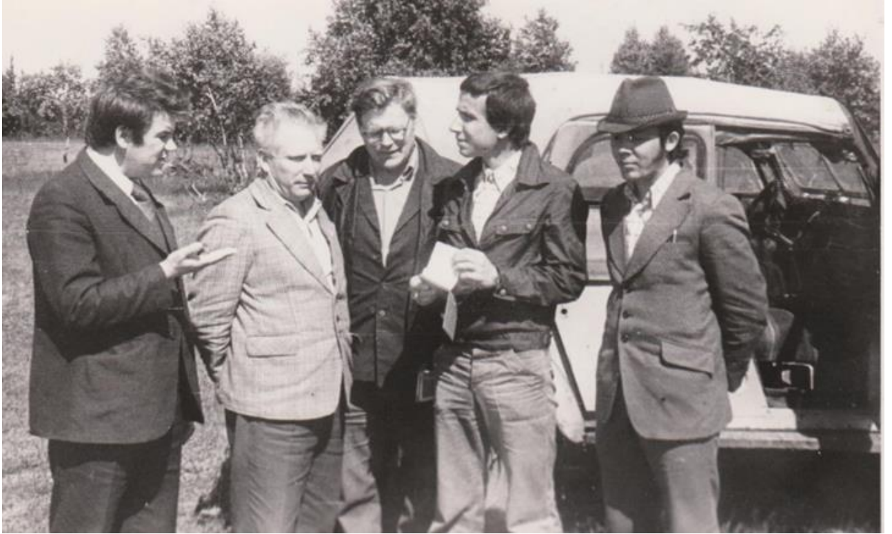
В колхозе «Заря» Хотынецкого района Орловской области 22.06.1977