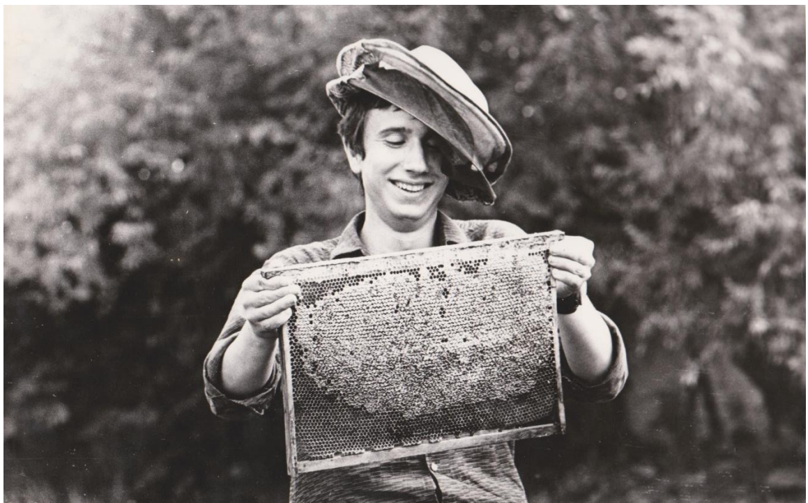
Материал об известном пчеловоде