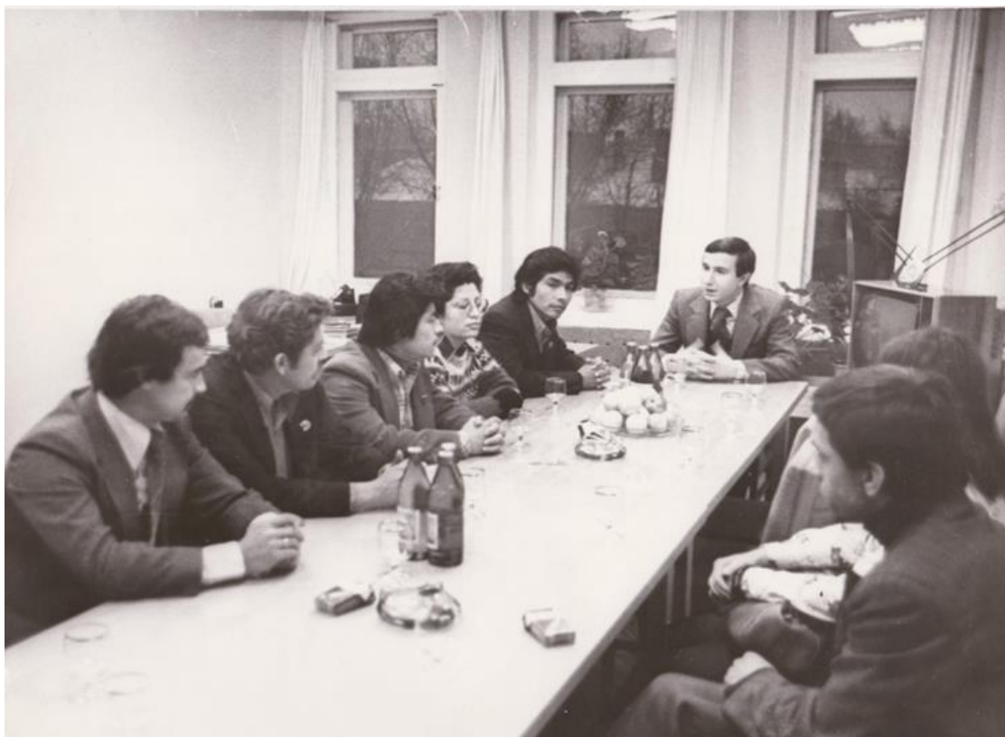
Планёрка в «Орловском комсомольце»