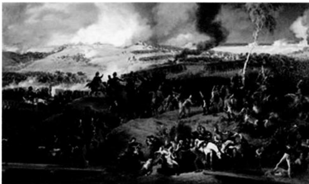
Дата 26 августа (7 сентября) 1812 года Место село Бородино (запад Московской области)