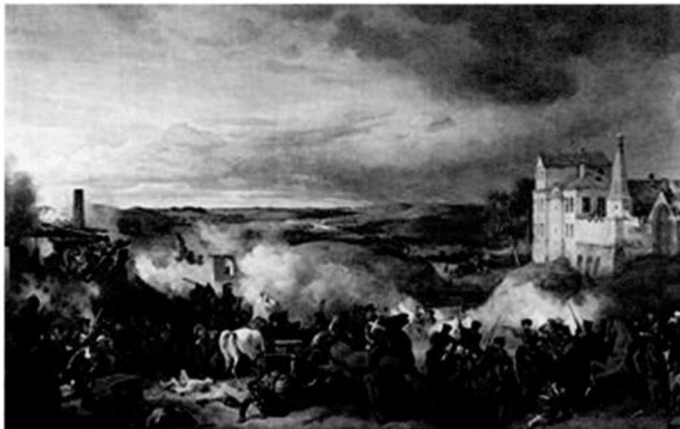
Петер фон Гесс. Дата 24 октября 1812 г. Место Малоярославец (Калужская область)