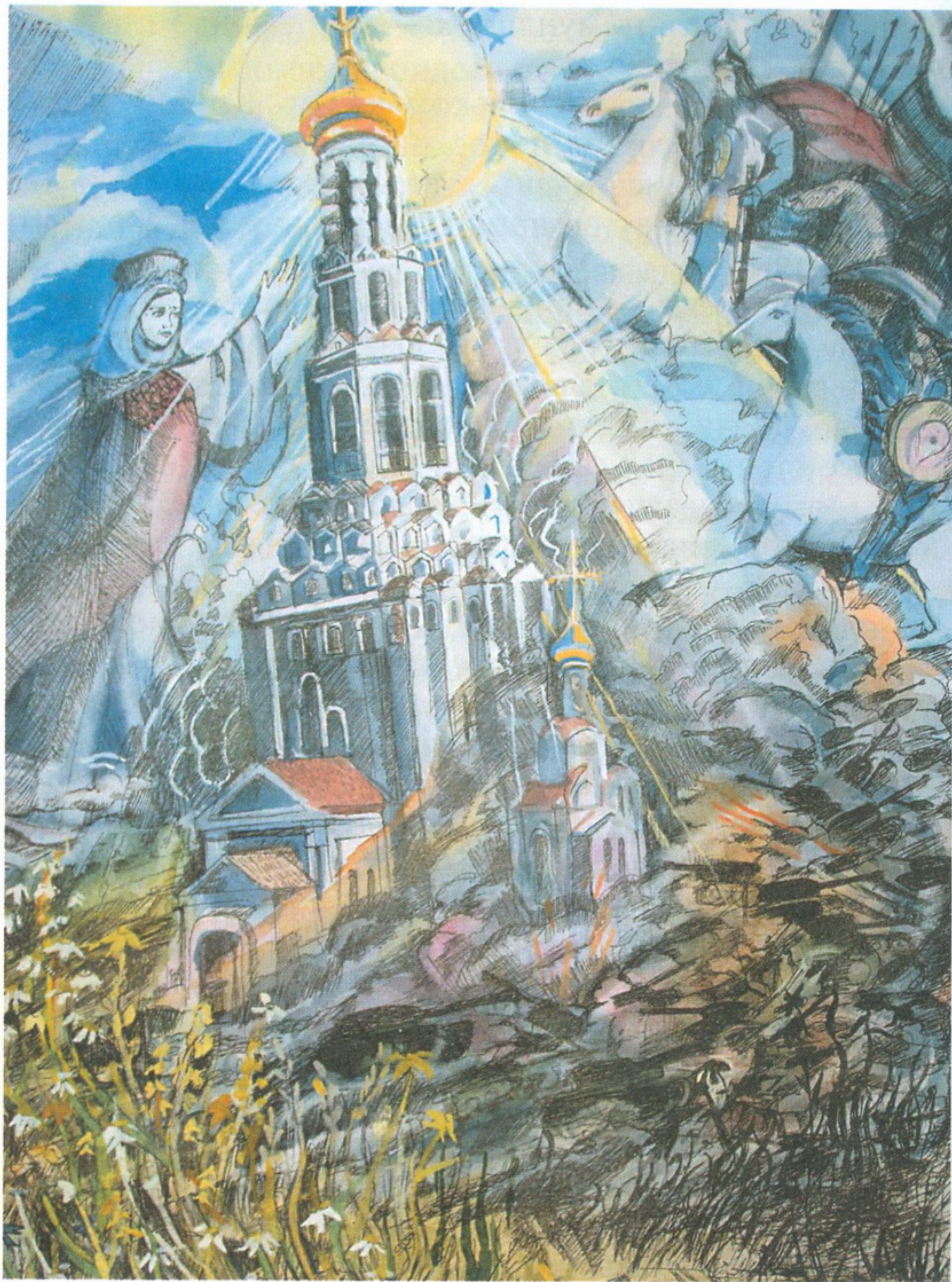
Видение на Прохоровском поле